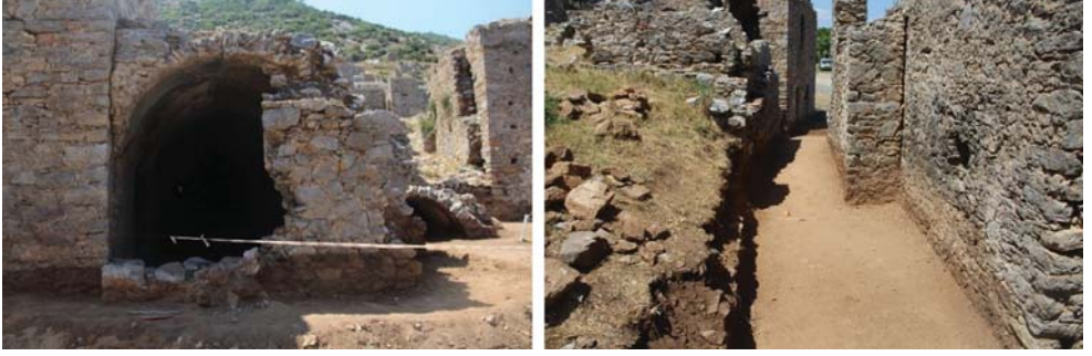
Levha 4: Anemurium A I 6 Nolu Mezar; Dođu ve Batı Cephelerdeki Eklenti Bölümler.