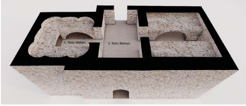
Levha 8: Anemurium A I 6 Nolu Mezar; II. Kat Restitüsyon Önerisi.