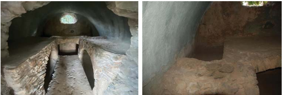
Levha 6: Anemurium A I 6 Nolu Mezar; I Nolu Mekan Genel Görünüşü ve Dikdörtgen Gömü Alanı.