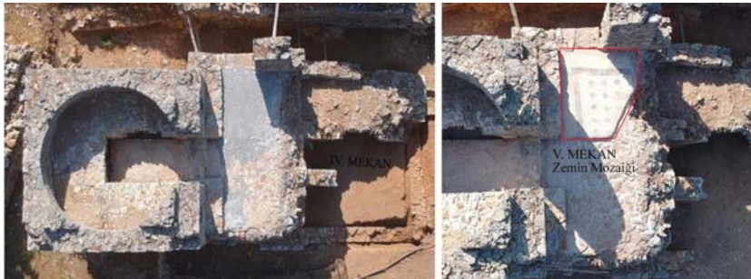
Levha 10: Anemurium A I 6 Nolu Mezar; IV Nolu Mekan ve V Nolu Mekan Zemin Mozaïği.