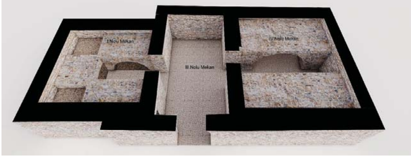
Levha 7: Anemurium A I 6 Nolu Mezar; I. Kat Restitüsyon Önerisi.