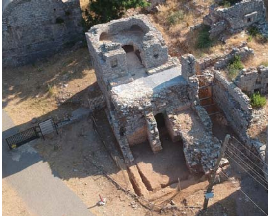
Levha 2: Anemurium A I 6 Nolu Mezar; Kuzeyden Genel Görünüş.