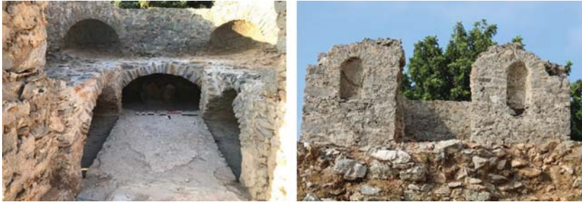
Levha 9: Anemurium A I 6 Nolu Mezar; II Nolu Mekan İçi, Kuzey Dış Cephe ve Nişler.