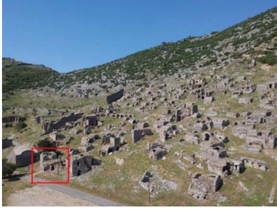
Levha 1: Anemurium Nekropolü Genel Görünümü ve A I 6 Nolu Mezarın Konumu.