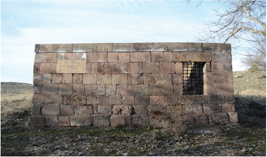
Resim 10. Şeyh Mehmed Sencerhiz'in Mezarı , Zülfıye Koçak, 2021.