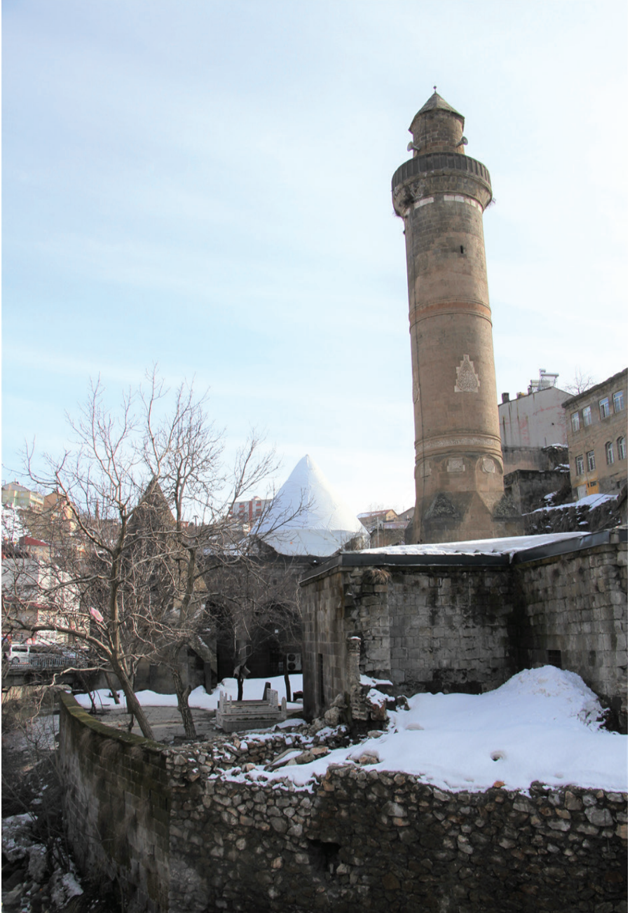
Resim 6. Şerefiye Külliyesi , Zülfıye Koçak, 2021.