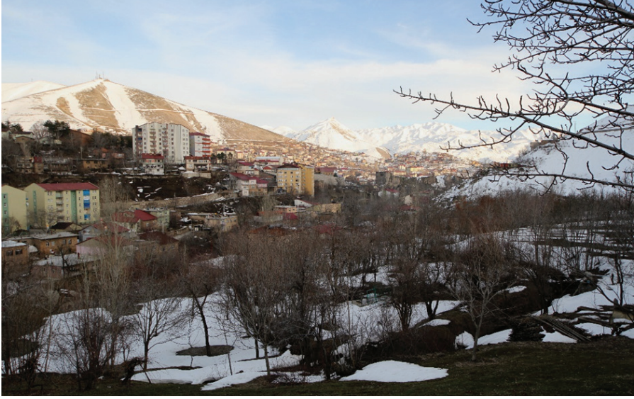
Resim 7. Şeyh İsa Mezarının Bulunduğu Bölge , Zülfiye Koçak, 2021.