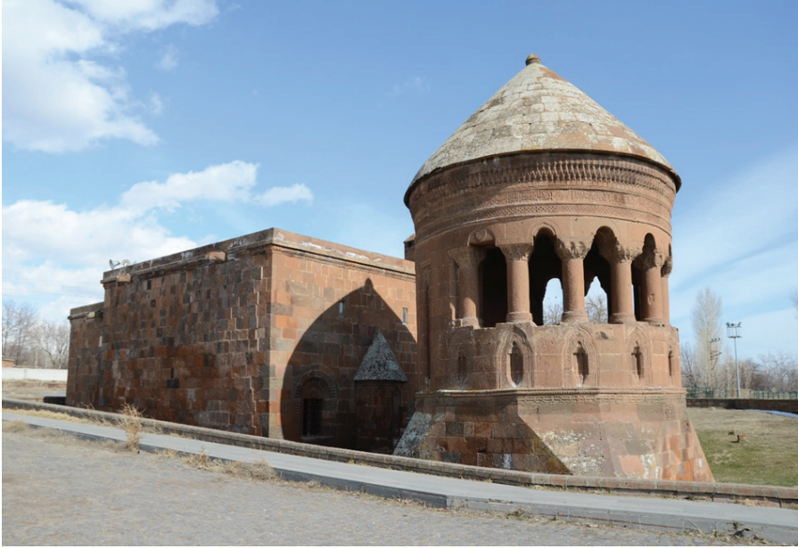
Resim 11. Bayındır Kümbeti ve Günümüzde Cami Olarak Kullanılan Yapı, Zülfiye Koçak, 2021.