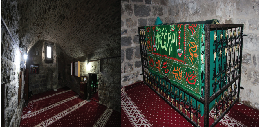
Resim 4. Şeyhü'l-Garib Zâviyesi'nin İç Mekânı ve Şeyhü'l-Garib Mezar Sandukası, Zülfıye Koçak, 2021.