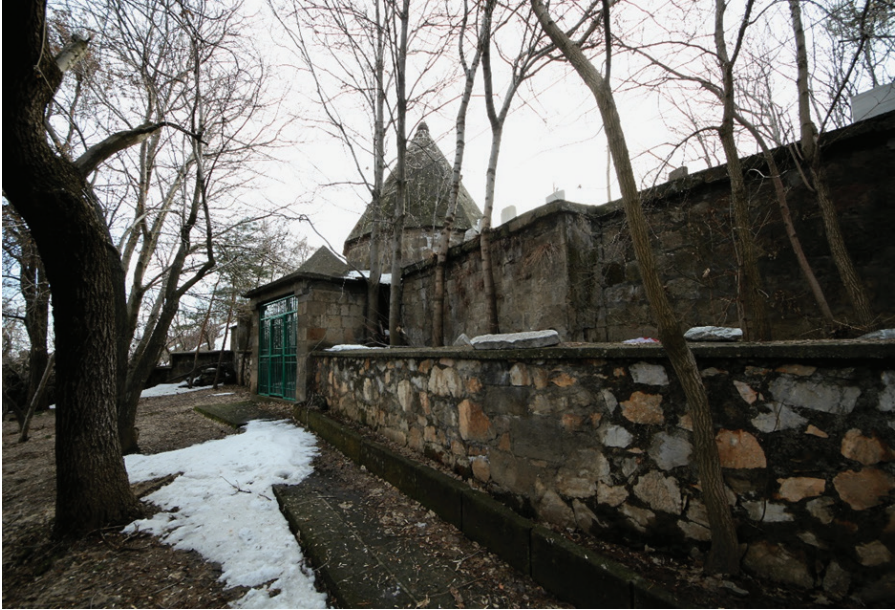
Resim 8. Şeyh Ebu Tahir-i Bidlîsî'nin Türbesinin Bulunduğu Yer , Zülfiye Koçak, 2021.