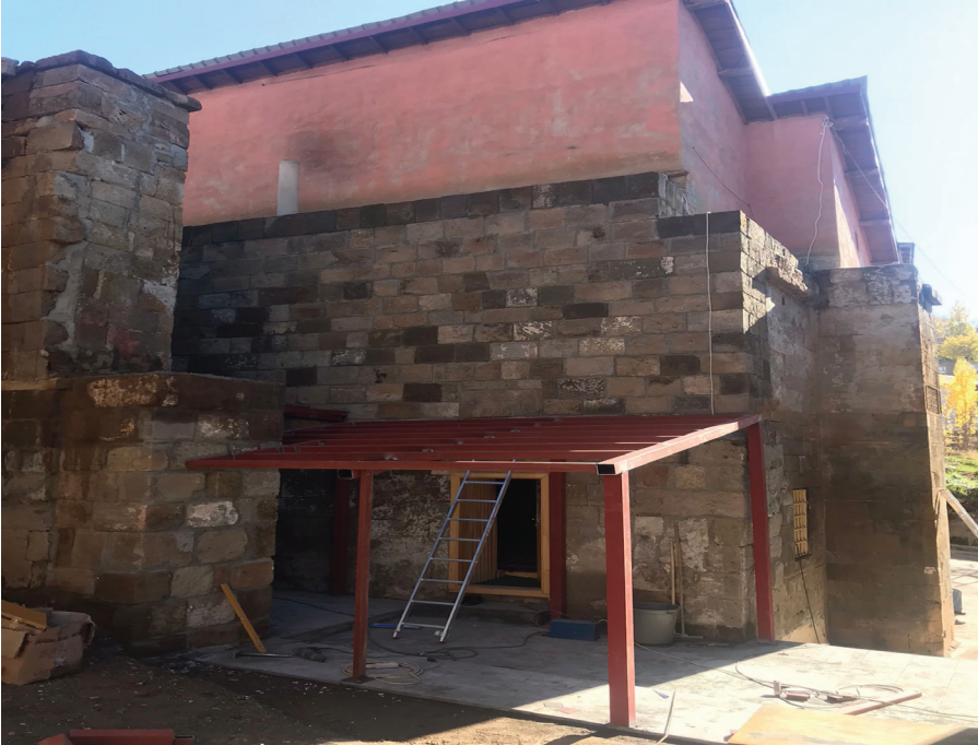
Resim 2. Seyyid İbrahim Camisi Olarak Anılan Cami, Zülfiye Koçak, 2021.