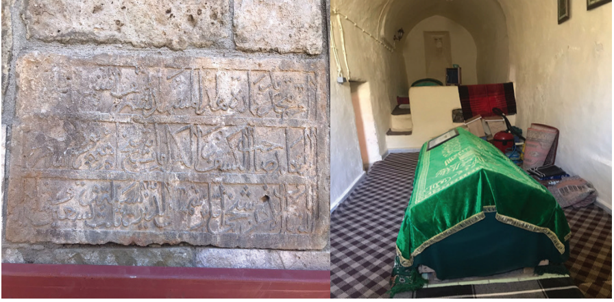
Resim 3. Seyyid İbrahim Camisinin Kitabesi ve Cami İçindeki Seyyid İbrahim Mezar Sandukası, Zülfıye Koçak, 2021.