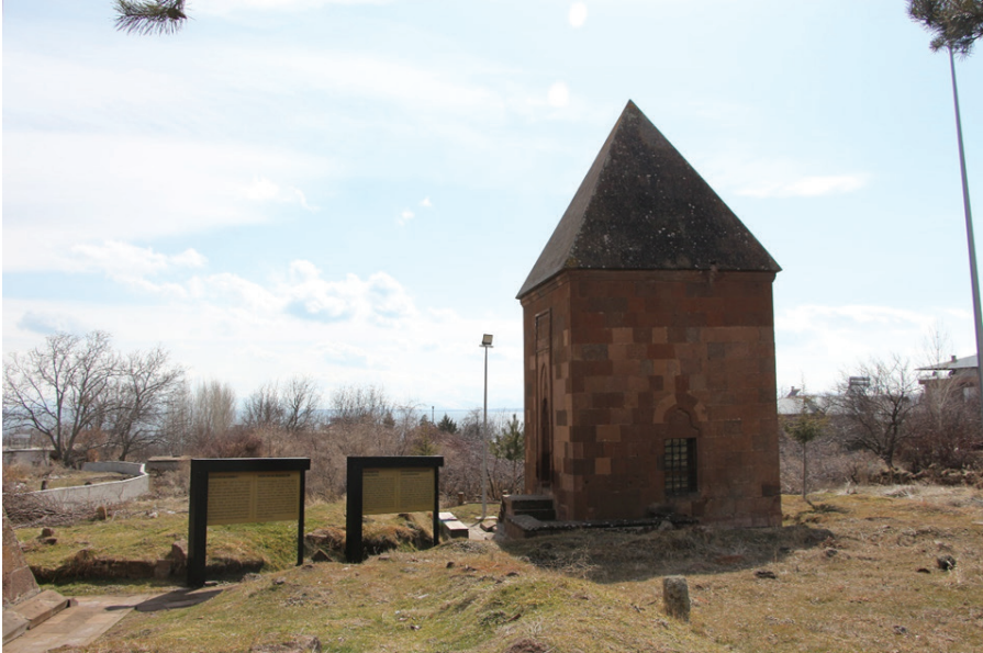
Resim 12. Şeyh Necmeddin Hevayî Türbesi, Zülfiye Koçak, 2021.