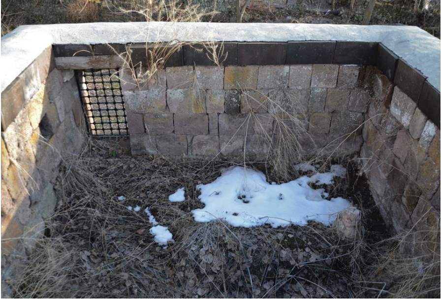
Resim 9. Şeyh Mehmed Sencerhiz'in Mezarı , Zülfıye Koçak, 2021.