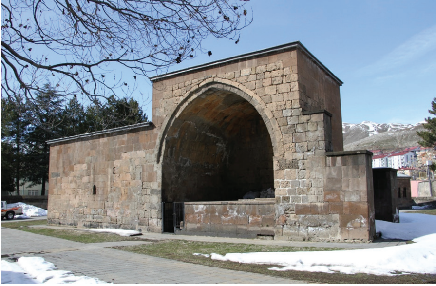
Resim 1. Emir Şemsüddin Zâviyesi, Zülfiye Koçak, 2021.