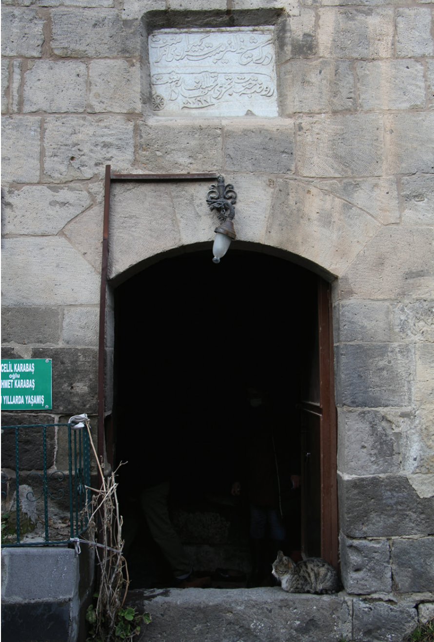
Resim 5. Şeyhü'l-Garib Zâviyesi'nin Giriş Kapısı ve Kapı Üzerindeki Kitabesi, Zülfiye Koçak, 2021.