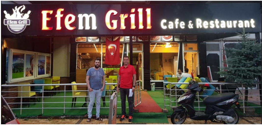
Fotoğraf 4. Almanya'daki birikimle Çaycuma'da açılan bir Cafe Restaurant örneği.