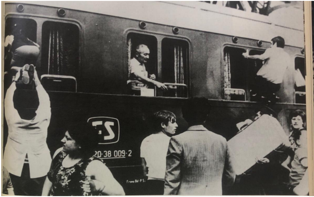
Fotoğraf 5. 1970'lerde Almanya ile Türkiye arasında tren seyahat örneği

Zonguldak-Çaycuma havaalanından Almanya'da Köln, Munster, Dortmund ve Düsseldorf'a karşılıklı uçuşlar yapılmaktadır. Corendon Havayolları pazartesi ve cuma günleri Dusseldorf'a, çarşamba günü ise Munster şehirlerine uçuş gerçekleştirmektedir (Fotoğraf 6). Yine aynı firma; perşembe, cumartesi ve pazar günleri ise Köln'e Zonguldak'tan karşılıklı seferler düzenlemektedir. Zonguldak/Çaycuma Havaalanı'ndan Almanya'ya yolcu taşıyan bir başka havayolu şirketi olan Sun Experes ise pazartesi, Çarşamba ve Cuma günleri ile hafta sonları Dusseldorf'a, perşembe günleri ise Dortmund'a karşılıklı seferler düzenlemektedir. THY ise salı, cuma ve pazar günleri Zonguldak /Çaycuma - İstanbul Havalimanı arasından karşılıklı seferler düzenlemektedir.