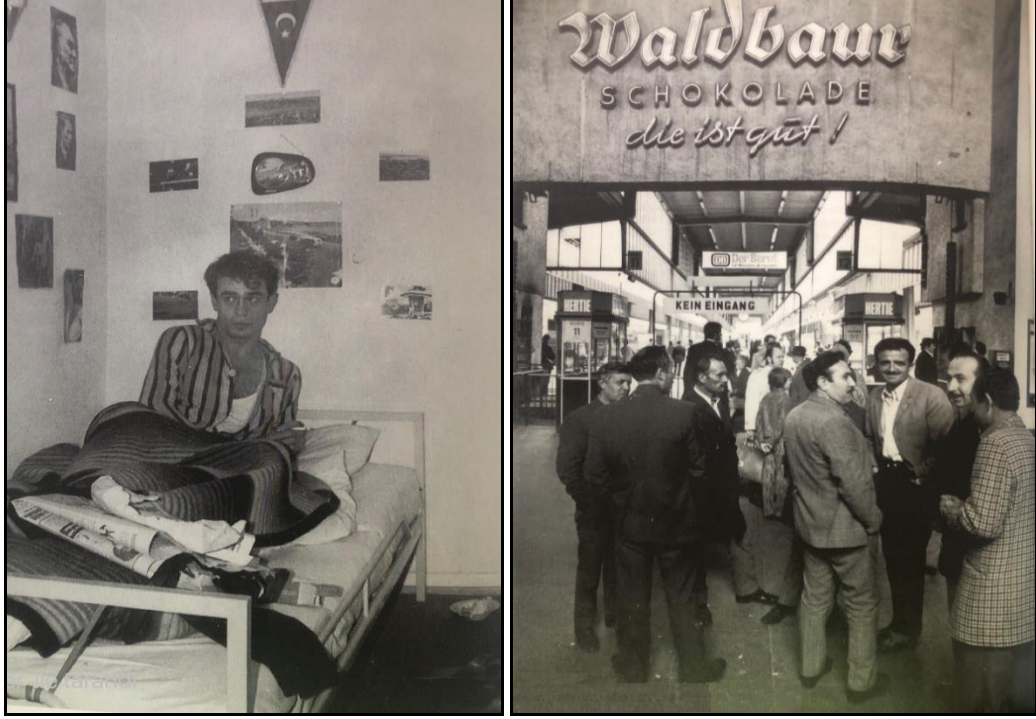
Fotoğraf 2. 1970'lerde Almanya'daki Türk İşçilerden Birer Görünüm (Emine Demirci Aile Arşivi)

kalacağını söyleyince bende gittim. İlk başta bir işim yoktu. Kokmuşumuzla bir gün otomotiv parçası üreten bir fabrikaya gittik iş müracaatında bulunduk ve kabul edildim. İyi ki gitmişim dedim sonra kadının iş hayatında olmasının kadının eğitilmesinin ne kadar önemli olduğunu ülkemde hissediyordum burada daha da iyi anladım." ifadelerine yer vermiştir.