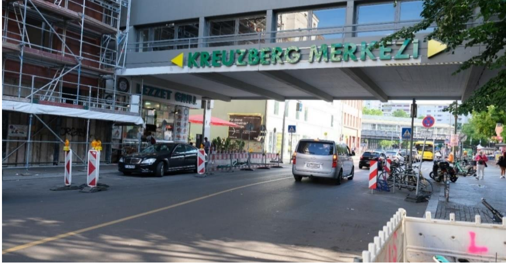
Fotoğraf 3. Almanya’da Türklerin işyerlerinin yoğunlaştığı alanlara bir örnek: Kreuzberg Merkezi.