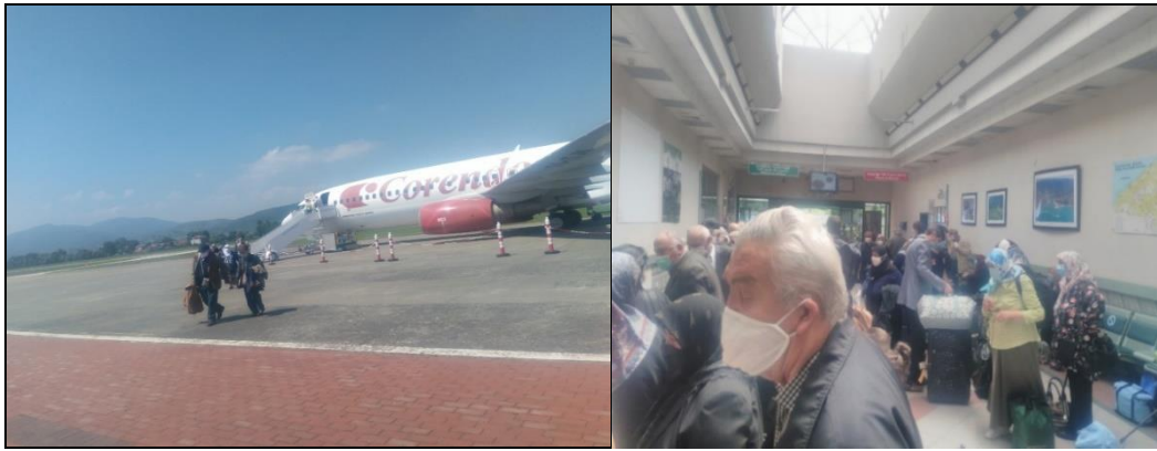
Fotoğraf 6. Zonguldak Çaycuma Havaalanı'ndan Almanya'ya karşılıklı seferler düzenlenir.

Zonguldak-Çaycuma havaalanından Almanya'da Köln, Munster, Dortmund ve Düsseldorf'a karşılıklı uçuşlar yapılmaktadır. Corendon Havayolları pazartesi ve cuma günleri Dusseldorf'a, çarşamba günü ise Munster şehirlerine uçuş gerçekleştirmektedir (Fotoğraf 6). Yine aynı firma; perşembe, cumartesi ve pazar günleri ise Köln'e Zonguldak'tan karşılıklı seferler düzenlemektedir. Zonguldak/Çaycuma Havaalanı'ndan Almanya'ya yolcu taşıyan bir başka havayolu şirketi olan Sun Experes ise pazartesi, Çarşamba ve Cuma günleri ile hafta sonları Dusseldorf'a, perşembe günleri ise Dortmund'a karşılıklı seferler düzenlemektedir. THY ise salı, cuma ve pazar günleri Zonguldak /Çaycuma - İstanbul Havalimanı arasından karşılıklı seferler düzenlemektedir.