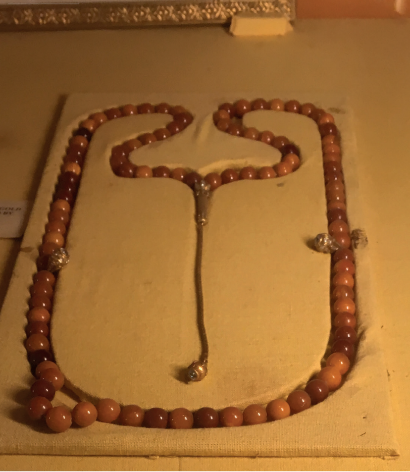
Ek 1: Abdülmecid Efendi'nin Haydarabad Nizamı Mir Osman Ali Han'a 1937 yılında hediye ettiđi kehribar tespihi.