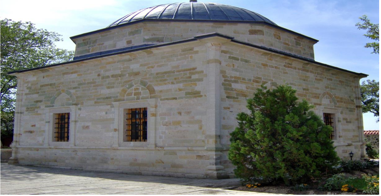
Ek 4: Sultan I. Bayezid'in iç organlarının medfûn olduğu Seyyid Mahmud Hayrani Türbesi bahçesindeki Ferruh Şah Mescidi/Akşehir 81