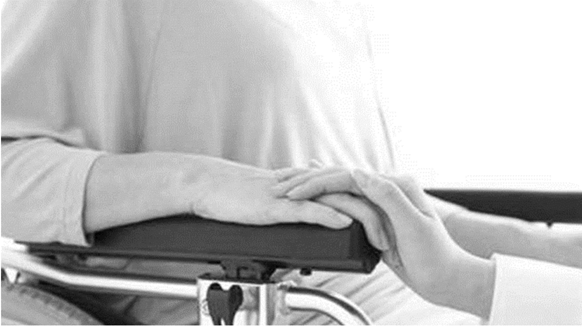
Şekil 3. Dışlanmak En Büyük Engel (Kaynak: https://www.aksam.com.tr/saglik/dislanmak-en-buyuk-engel/haber-467774 , Erişim tarihi: 09.08.2020)

Bu tema altında sadece “Dışlanmak en büyük engel” (Akşam, 2015) başlıklı haber doğrudan ayrımcılık karşıtı bir mesaj içermektedir. Spotta “Engellilik bireyi fiziksel ve zihinsel olarak etkileyebildiği gibi psikolojik yönden de oldukça zorlar. Özellikle toplumun engellilere karşı olumsuz düşünce ve tavırları bu süreci hızlandırabilir” şeklindeki ifade hem genelleşici hem de açıklayıcı bir anlatımla sakatlığı zorluklarla eşleştirmektedir. Haberde kullanılan temsili görselde bir tekerlekli sandalye kullanıcısının elini tutan başka bir el görülmekte ve şefkat, yardım, destek anlamları oluşturulmaktadır. Haberde görsel gibi bir diğer retorik unsur ise psikolog yorumlarına yer verilerek uzman diliyle inandırıcılığın artırılmasıdır. Uzman diliyle metinde verilen “Engelli bireyin fiziksel veya zihinsel işlevselliklerindeki bozukluk hareket yeteneğini ve davranışlarını da etkilediğinden toplumun diğer kesimi tarafından dışlanabilirler” mesajı ise sakat bireyleri edilgen olarak konumlandırmakta ve ayrımcılık kaynağını toplumsal yapılardan ayırarak yeti yitimli bireylere yüklemektedir.