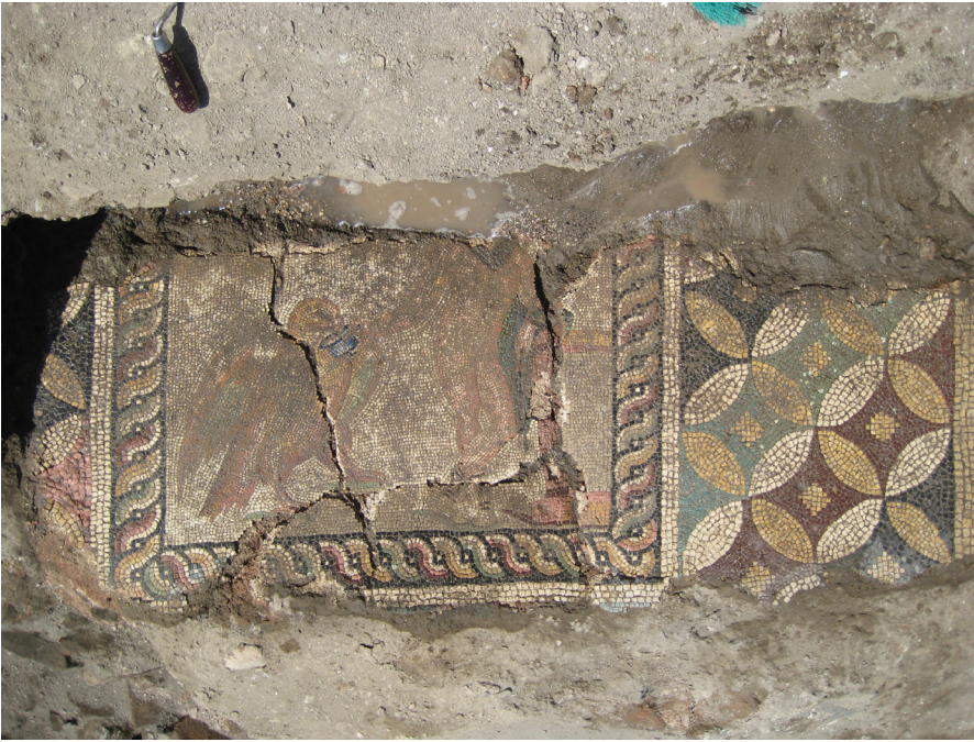
Resim 1 Claudiopolis Ganymedes Mozaïği.

Bithynion-Claudiopolis (Bolu), (Kent hakkındaki kaynakça için bk. Magie 1950: 307, 546, 590, 596, 614, 622, 1190-1191; Dörner 1952: 32-67; Vermeule 1968: 317-318, 151; Boatwright 2000: 100, 105) Antik Dönem’de Bithynia Bölgesi sınırları içerisinde yer alan önemli bir kentti. 2011 yılında kent merkezinde yapılan kurtarma kazısı 1 çalışması esnasında Ganymedes mozaïği açığa çıkarılmıştır (Res. 1, Çiz. 1). Dikdörtgen panolar biçiminde kesilen mozaik, plakalar halinde Bolu Müzesi’nin deposuna kaldırılmıştır. Mozaik tabanı 3,60 x 6,70 m ölçülerindedir. Mozaïğin yapımında 1 cm küplük doğal taşlar ve asıl sahne bölümünde de 0,5 cm. küplük daha küçük boyutlu tesseralar kullanılmıştır. Mozaik döşemenin neredeyse tümü yok olmuştur. Yalnızca merkezde yer alan figürlü pano ve geometrik bordüre ait çok az bir parça korunmuştur. Figürlü panoda üç adet derin çatlak oluşmuştur ve Ganymedes’in başı eksiktir. Mozaik döşemenin belli yerlerinde düşen sütun gövdesi ve sütun başlığı sebebiyle çökme meydana gelmiş ve buna bağlı olarak kabarmalar oluşmuştur.