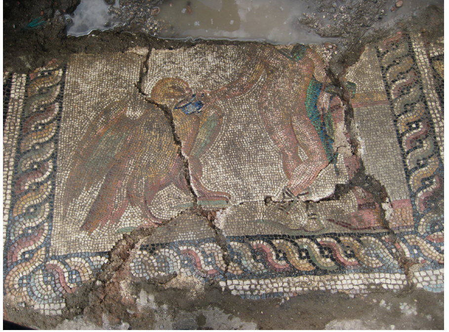
Resim 3 Claudiopolis Ganymedes Mozaïği figürlü panel detayı (Bolu Müzesi Arşivi).

yerleştirmiştir. Arkadan gelen khlamys sol el bileği üzerine atılarak buradan aşağıya sarkıtılmıştır. Sol elinde bir pedum tutmaktadır. Sağ kolunu yana doğru açmıştır ve sağ elinde tuttuğu kadeh ile kartal'a içki sunmaktadır. Vücut ağırlığını sabit olan sağ bacak taşımaktadır. Bu nedenle kalça konturu belirli bir kavisle bu yanda dışa doğru çıkmıştır. Sol bacak dizden bükülerek önde sağ bacağın üzerinden çapraz olarak atılmış ve bot giymiş olan ayak yalnızca parmak uçları ile yere basmıştır. Krem rengi olan botlarının, bağcıkları ise koyu kahverengindedir. Duruşu itibariyle "S" çizen bir vücut hareketi ortaya çıkmıştır. Benzer örneklerde olduğu gibi başında bir Phryg başlığı taşıyor olmalıdır. Duruş biçimi ve hareketi dikkate alındığında başını kendi sağına doğru çevirmiş yani sol tarafında yer alan kartal'a doğru bakmakta olduğu anlaşılmaktadır. Ganymedes'in çıplak teni açık pembe ve krem rengi ile gölgelendirilmiştir. Ayaklarının altındaki gölge yeşil renkte iki sıra tesseradan oluşmuştur.