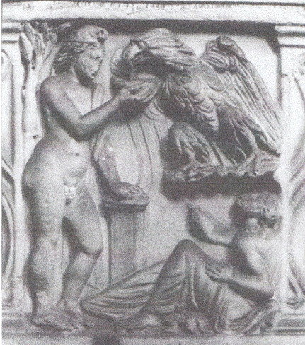
Resim 8 Yivli Lahit üzerinde Ganymedes ve Kartal Sahnesi (Bartman 2000: fig. 11.12).