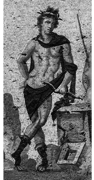
Resim 9a-b Antiocheia Adonis Mozaïği.

Farklı bir mitolojik konu işlenmiş olmasına rağmen Prusias ad Hypium Orpheus mozaïği (Res.10-11), (İS 3.yüzyılın sonu-4.yüzyılın başları), (Sezer 2015: 124 fig. 1) figürlü panelin etrafını basit örgü bandının ve kesişen dairelerin çevirmesinin yanı sıra basit örgü motifinin ilmeklerindeki renk tonlamaları ve ışık-gölge etkisinin oluşturulmasıyla Claudiopolis Ganymedes mozaïği ile ortak özellikler taşımaktadır.