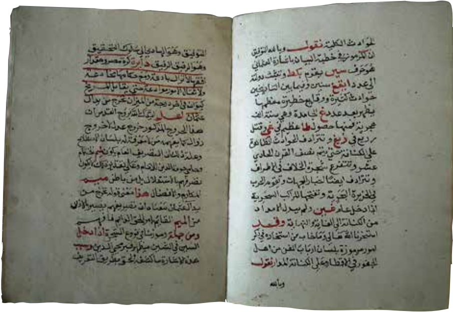
II) Yavuz Selim'in Şam'a girdiğinde Muhyiddin İbnü'l-'Arabî'nin kabrinin bulunacağını bildirdiği cümle (sol ikinci sayfanın alttan ikinci ve üçüncü satır)