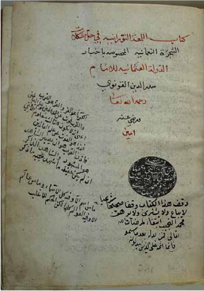
III) Kitab'ul-Lem'ati'n-Nûraniyye fî Hall'i Müşkilâtî's-Şeceretî'n-Nu'maniyye el-mahsûsa bi-Abbâri'd-Devleti'l-Usmaniyye, li'l-İmam Sadreddin el-Kunevî Sadreddin-i Konevî'nin yazdığı şerhin kapak sayfası Tire Necip Paşa Kütüphanesi yazmaları, DV 340