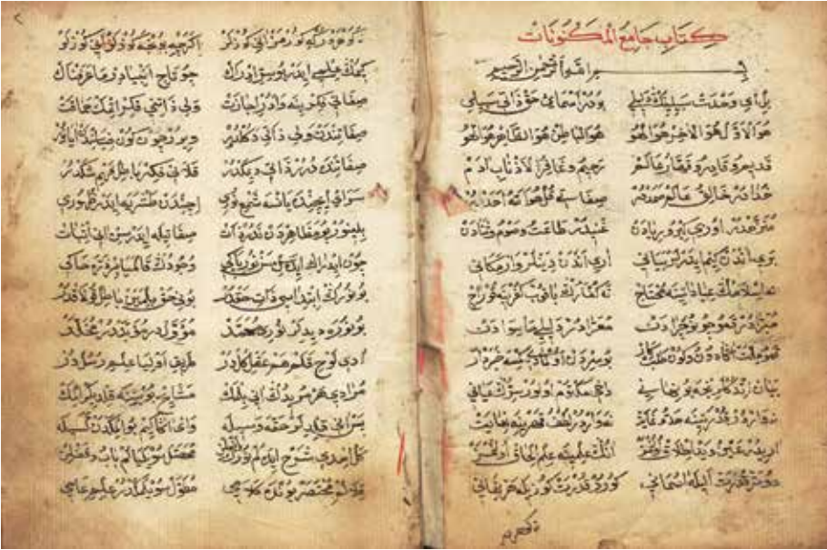
VII) Mevlânâ 'Îsâ, Kitabu Câmi'i'l-Meknûnât , başlık sayfası, (İstanbul Üniversitesi Kütüphanesi, İbnülemin Mahmud Kemal Yazmaları, no. 3263)