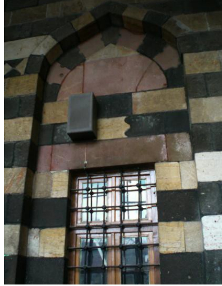
Foto. 16 Gaziantep Handan Bey Camii Son Cemaat Yeri Pencerelerinden Birisi.