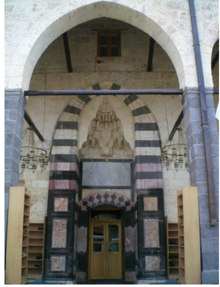
Foto. 8 Gaziantep Şeyh Fetullah Camii Harim Taçkapısı.