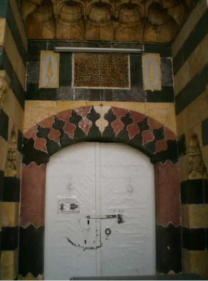
Foto. 9 Gaziantep Bostancı Camii Harim Taçkapısı.