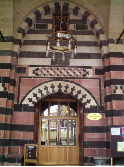
Foto. 7 Gaziantep Nuri Mehmet Paşa Camii Harim Taçkapısı