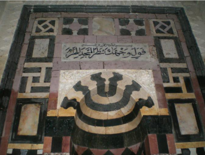
Foto. 12 Gaziantep Şeyh Fetullah Camii Mihrap Detayı.