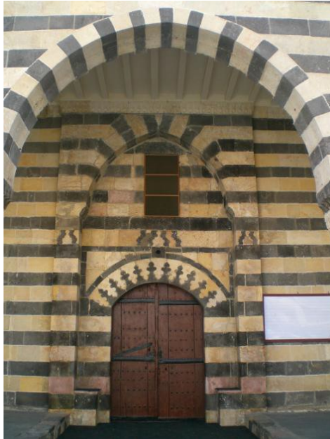
Foto. 6 Gaziantep Ağa Camii Harim Taçkapısı.