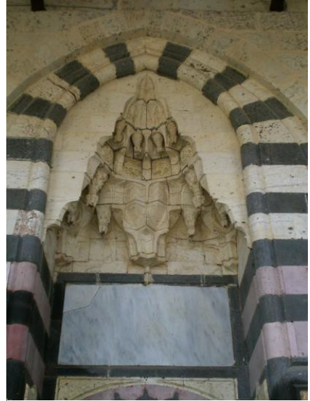
Foto. 10 Gaziantep Şeyh Fetullah Camii Harim Taçkapısı. Mukarnashı Kavsaradan Detay.