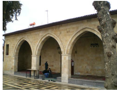
Foto. 30 Gaziantep Kozanlı Camii Avlu Döşemesi.