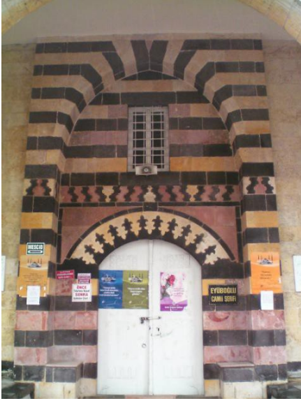
Foto. 1 Gaziantep Eyüboğlu Camii Harim Taçkapısı.