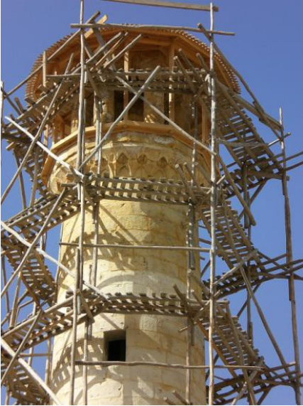
Foto. 25 Gaziantep Ali Nacar Camii Minaresi Detayı.