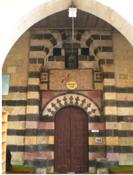
Foto. 2 Gaziantep İhsan Bey Camii Harim Taçkapısı.