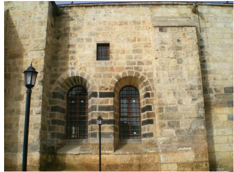
Foto. 18 Gaziantep Boyacı Camii Güney Cephesi Pencereleri.