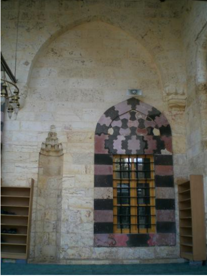
Foto. 19 Gaziantep Şeyh Fetullah Camii Son Cemaat Yeri Batı Penceresi.