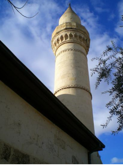
Foto. 27 Gaziantep Şeyh Fetullah Camii Minaresi.