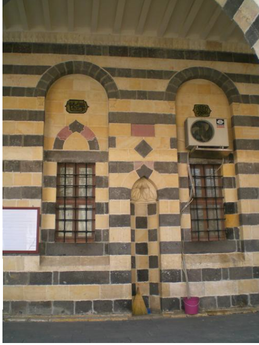
Foto. 13 Gaziantep Ağa Camii Son Cemaat Yeri Pencereleri.