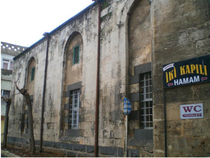
Foto. 14 Gaziantep Eyüboğlu Camii Cephelerindeki Pencereler.