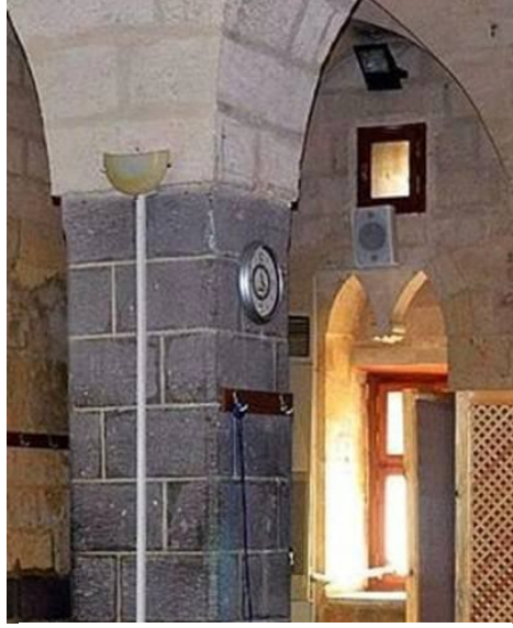
Foto. 20 Gaziantep İhsan Bey Camii Hariminde İkiz Kemerli Pencere.