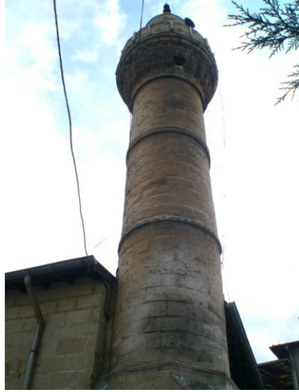
Foto. 24 Gaziantep Ahmet Çelebi Camii Minaresi