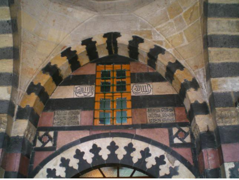
Foto. 5 Gaziantep Karatarla Camii Harim Taçkapısı.