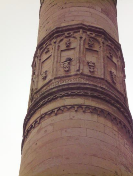
Foto. 23 Gaziantep Eyüboğlu Camii Minaresi Gövdesinden Detay.