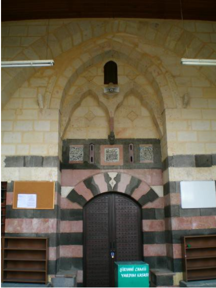
Foto. 3 Gaziantep Şirvani Camii Harim Taçkapısı.