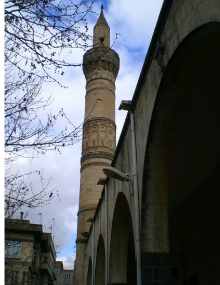
Foto. 22 Gaziantep Eyüboğlu Camii Minaresi.