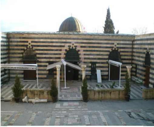
Foto. 29 Gaziantep Boyacı Camii Avlu Döşemesi.