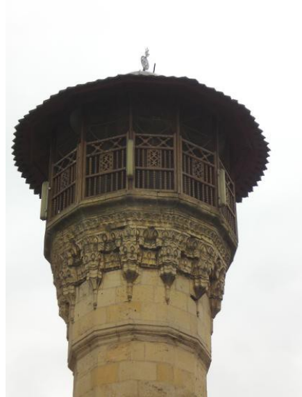
Foto. 26 Gaziantep İhsan Bey Camii Minaresi Şerefesi.