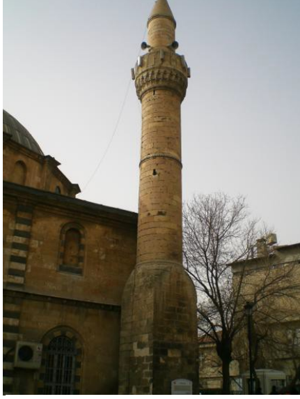
Foto. 28 Gaziantep Alaüdevle Camii Minaresi.