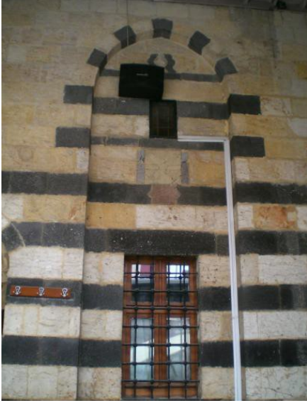
Foto. 15 Gaziantep İhsan Bey Camii Soncemaat Yeri Pencerelerinden Birisi