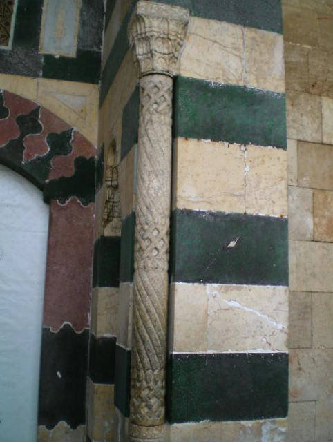
Foto. 11 Gaziantep Bostancı Camii Harim Taçkapısı. Köşe Sütuncesinden Detay