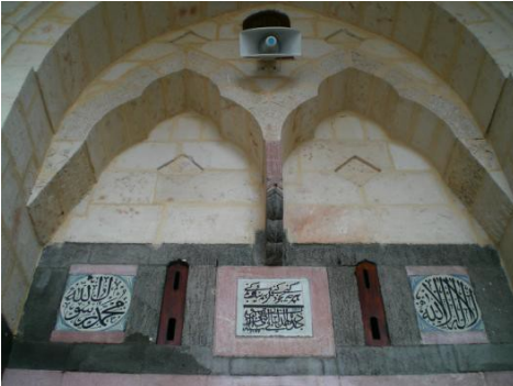
Foto. 21 Gaziantep Şirvani Camii Harim Taçkapısı Dilimli İkiz Kemer.