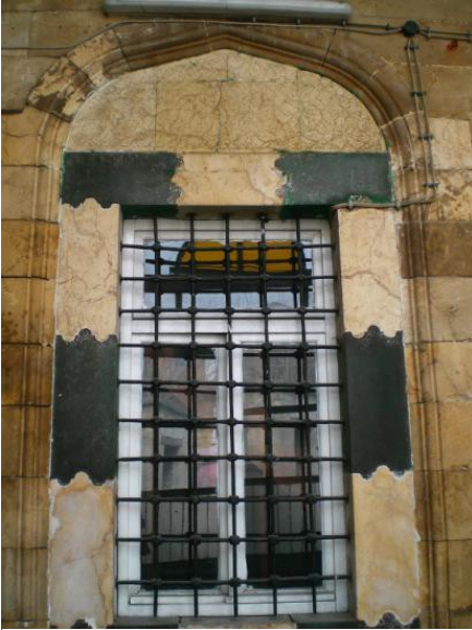
Foto. 17 Gaziantep Bostancı Camii Son Cemaat Yeri Pencerelerinden Birisi.