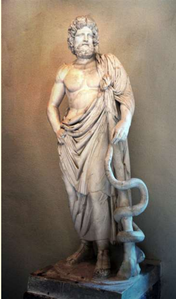
Şekil 2. Tıp ve sağlık tanrısı Asclepios heykeli (Epidauros Asclepion Müzesi, Yunanistan).

Simgesi kutsal yılan ve asa olan Asklepios (ya da Romalılar dönemindeki ismiyle Eskülap), mitolojiye göre tanrı Apollon'un oğludur ve hekimlik bilimini öğrenir. Hekimliğin sembolü sayılan Asklepios'un asasının üzerinde asaya sarılı yılan yer almaktadır. Yılan Asklepios'un kutsal hayvanıdır 1 ( Şekil 2 ).