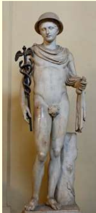
Şekil 3. Mitolojik tanrılardan haberci tanrı Hermes ve asası. Tüccarların ve yolcuların tanrısı olarak bilinir. Elinde Caudeus adı verilen bir asa taşır (Vatikan Müzesi, Vatikan, İtalya).

Yunan mitolojisindeki tanrılardan Hermes, Zeus'un oğlu, tanrıların kanatlı habercisi, yolcuların hamisi ve tüccarların koruyucusudur. 4 Hermes'in iki yılan ile sarılı altından Caduceus (ya da kadüse) adlı bir asası vardır ( Şekil 3 ).