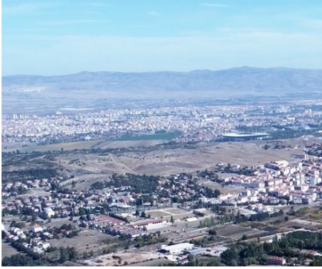
Figür 1: Karacahisar Kalesi Hava Fotoğrafi

tarihsel bağlamları ile ele alındığı ve ikonografik analizlerine yönelik detaylı analiz ve değerlendirilmeleri içeren bilimsel çalışmaların yeterli düzeyde olduğunu söylemek güçtür. 3 Bu bağlamda çalışmamızda ele alınan sikke ve jetonların standart katalog verilerinin yanısıra temsil ettikleri uygarlık, dönem ve ele geçtikleri arkeolojik alan olarak Karacahisar Kalesi'nin tarihi ile birlikte ele alınarak değerlendirilmesi hususunda bir çabaya da bu çalışmada yer verilmiştir.