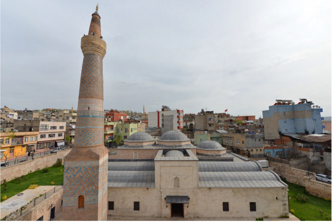
Fotoğraf 1: Siirt Ulu Camii ve Minaresi ( https://www.akmb.gov.tr/Bilgi.aspx?ID=351 )