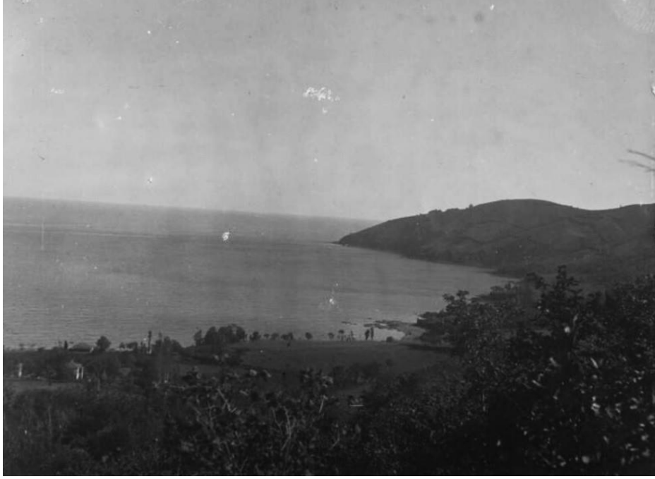
Fotoğraf 2: Mersin Körfezi (, Bucht von Mersin: Blick auf die Bucht und das Meer vor Mersin, 1926-1927)