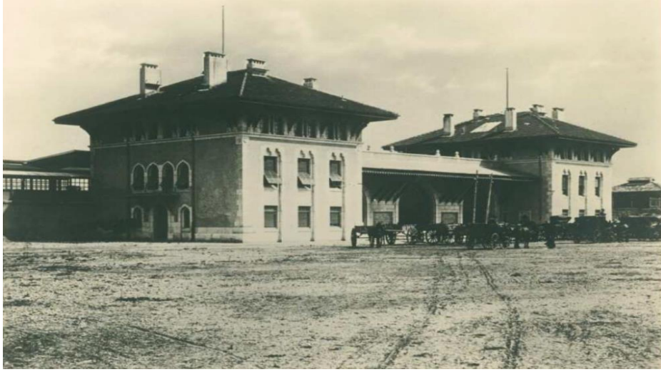
Fotoğraf 3: Adana Garı