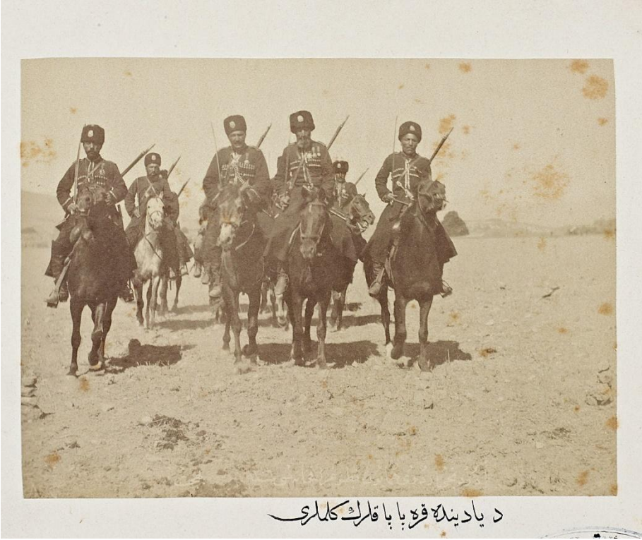
Foto 5: “Diyadin’de Karapapakların Gelmeleri”, NEKYA, 90877-0018.