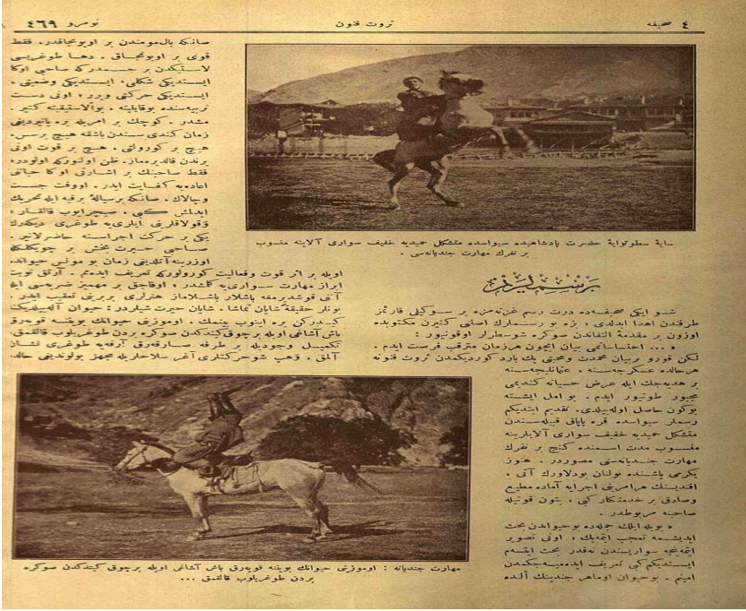
Foto 4: “Maharet-i cündiyane: Omuzunu hayvanın boynuna koyarak baş aşağı öyle birçok gittikten sonra birden doğrulup kalkmak...” Servet-i Fünûn, sayı: 469, iç sayfa, s. 4-5, 24 Şubat 1315/08.03.1900.