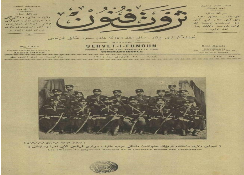
Foto 2: “Sivas Vilayeti Dahilinde Karapapak Aşireti’nden müteşekkil Hamidiye Hafif Süvari 40. Alayı Ümera ve Zabitanı”, Erzincan Muhabirimizden gönderdiği fotoğraftan, Servet-i Fünûn, sayı: 413, kapak resmi, 28 Ks 1314/09.02.1899.