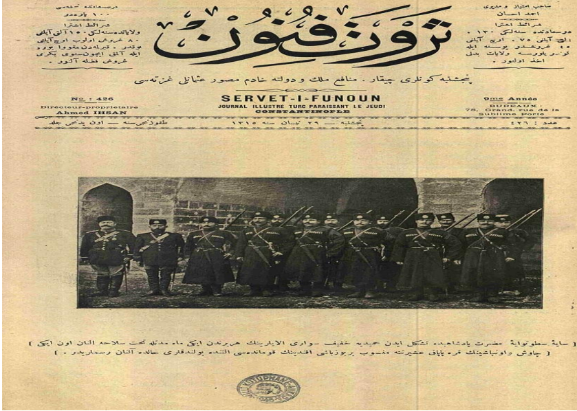
Foto 3: “Saye-i satvet-vaye’i Hazreti Padişahî’den teşekkül eden Hamidiye Hafif Süvari Alaylarının her birinden iki mah-ı müddetle taht-ı silaha alınan 12 çavuş, ve onbaşının Karapapak Aşireti’ne mensub yüzbaşısı efendinin kumandası altında buldukları halde alınan resimleridir.”, Servet-i Fünûn, sayı: 426, kapak resmi, 29 Nisan 1315/11.05.1899.