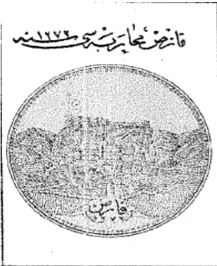
Foto 10: Kars Muharebesi madalyası, Salname-i Askerî , Matbaa-i Askeri, İstanbul 1311 (1895), s. 1047.