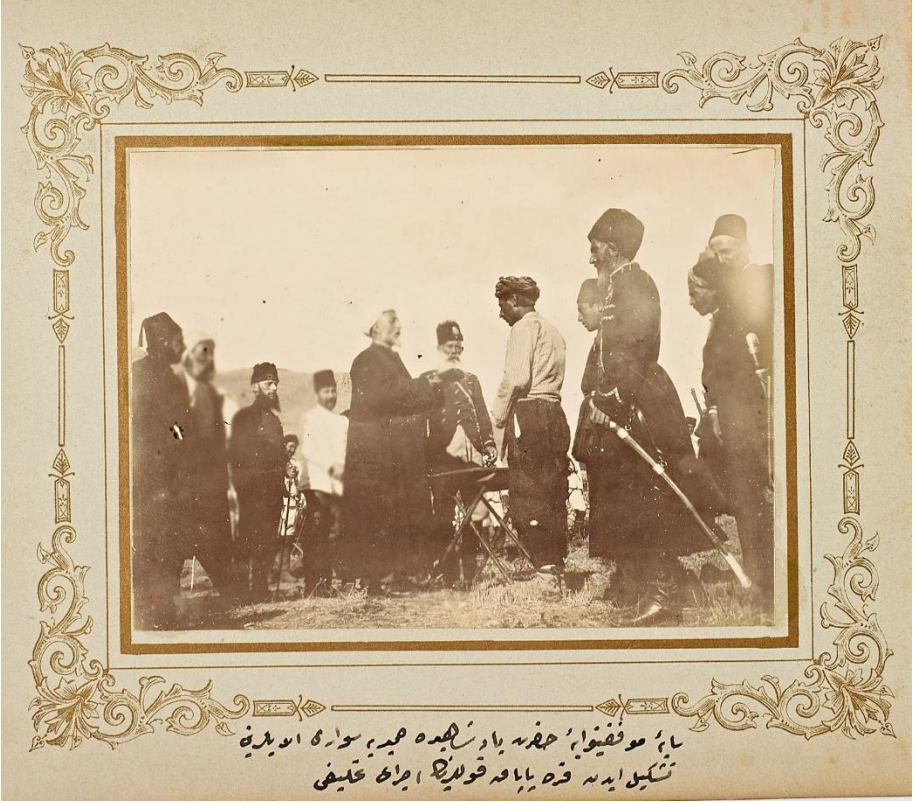
Foto 6: “Saye’i muvaffakiyet-vaye’i Hazreti padişahîde Hamidiye Süvari Alaylarını teşkil eden Karapapak kullarının icra-yı tahlifi”, Karapapak Hamidiye Yemin Töreni, NEKYA, 91170-10.