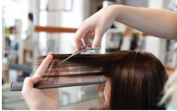
Şekil 4. Kuaför figürü örneği.