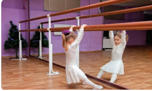
Şekil 5. Tek başına bulunan figür örneği.

erkeklerden daha fazla görsellerde yerini almıştır. Görsellerde erkekler tek başına (f:83), çocuklarla (f:21), yetişkinlerle (f:62), ailesiyle (f:4) birlikte kızlardan daha fazla yer almıştır. Kızlar ise sadece kalabalık (f:2), yetişkin ve çocuklarla (f:11) birlikte erkeklerden daha fazla görsellerde belirlenmiştir. Ders kitaplarında yer verilen figürlerin kimlerle beraber olduklarına dair bazı görsellere aşağıda yer verilmiştir.