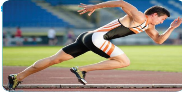
Şekil 9. Spor yapan figür örneği (Kaynak: Fen Bilimleri 8 (Adım Adım Matbaa) Yiğit, 2021:49).

Son olarak ise 8. sınıf ders kitaplarında erkekler en fazla iş yeri ve çevresinde (f:16), kızlar ise okulda ya da öğrenmeye yönelik (f:16) faaliyetler içerisindeyken görsellerde yer aldıkları belirlenmiştir. Tablodaki önemli bir bulgu ise ders kitaplarının tamamında figürlerin kültür-sanat işlerine (f:0) dair görsellerde herhangi bir faaliyet içerisinde gösterilmemesidir. Diğer bir bulgu ise erkeklerin sosyal (f:32), sportif (f:27), oyun-hobi (f:30), iş yeri ve çevresindeki faaliyetlerde (f:34), eylemsiz-sabit (f:13), ev (f:3) faaliyetlerinde kızlardan fazla görsellerde yer verilmiştir. Kızlar ise okulda ve öğrenmeye yönelik (f:23) ile kişisel (f:17) faaliyetlerde erkeklerden daha fazla görsellerde yerini almıştır. Ders kitaplarında yer verilen figürlerin olası eylemlerine dair bazı görsellere aşağıda yer verilmiştir.