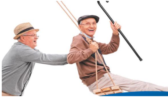
Şekil 2. Erkek figürü örneği (Kaynak: Fen Bilimleri 6 (MEB) Demirçalı ve Alkan, 2020: 88).