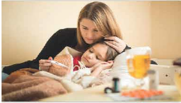
Şekil 6. Ailesiyle bulunan figür örneği (Kaynak: Fen Bilimleri 6 (MEB) Demirçalı ve Alkan, 2020: 198).