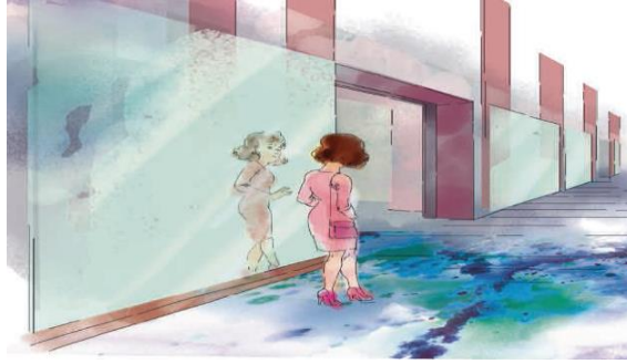
Şekil 1. Kız figürü örneği (Kaynak: Fen Bilimleri 5 (MEB) Akter, Arslan ve Şimşek, 2020: 173).