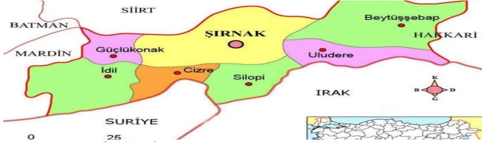
Şekil 1: Cizre ve çevresi haritası (AFAD, 2022).

geçen ve ona hayat veren Dicle Nehri'ni barındırması ilçenin önemini arttırmaktadır. Dicle Nehri geçmişte bölgeyi ada konumunda bıraktığından ismini ada anlamına gelen "Cezire" den almıştır. İslam hakimiyeti altına girip İslam kültürünü benimsedikten sonra bölge cazibe merkezi haline gelmiştir. Günümüze kadar ulaşan; Kırmızı Medrese, Abdaliye Medresesi, Mecidiye Medresesi (bugün Şeyh Seyda Camii), Süleymaniye Medresesi (bugün Meydan Başı Cami), Nizemülmülk'ün Cizre'de inşa ettirdiği Radviye Medresesi gibi yapıların varlığı bunun kanıtıdır (Saban, vd., 2013).