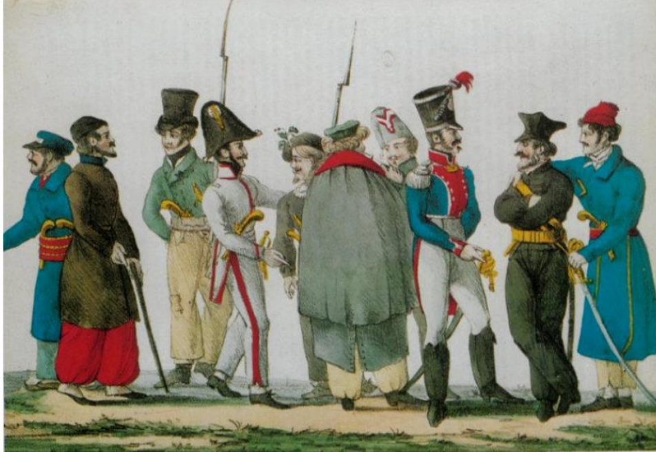
Ek-5: Filhelen Batlı Subaylar

Κύριον Δημήτριον Καρατζένην - Ἀθήνας Ἀγαπητὲ Κύριε,