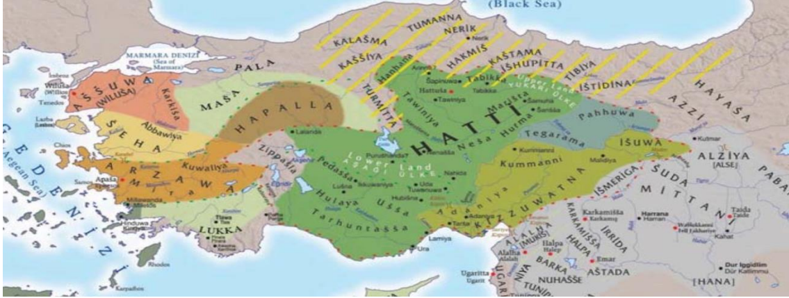
Harita 3.