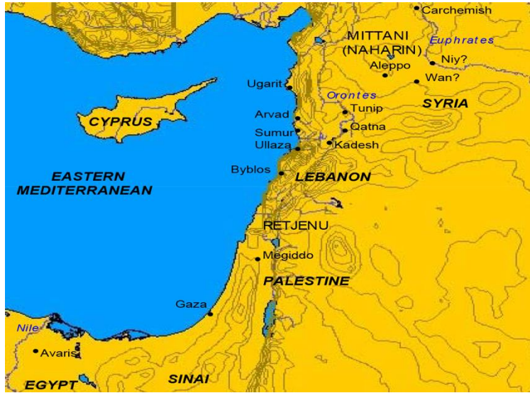
Harita 2.