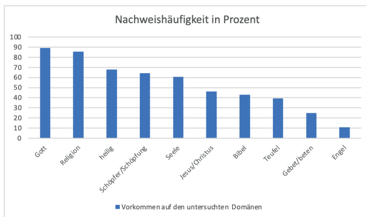
Abb. 2: Nachweishäufigkeit der untersuchten Begriffe

Es ist deutlich erkennbar, dass die Begriffe Gott , Religion , heilig , Schöpfer/Schöpfung und Seele jeweils bei deutlich mehr als der Hälfte der Domänen Verwendung finden. Hieraus lässt sich ganz allgemein schließen, dass Religion auf den untersuchten Seiten durchaus Relevanz besitzt. Da eine rein quantitative Erhebung allein noch keine verlässlichen inhaltlichen Befunde ergibt, seien hier exemplarisch einige Vorkommen der Begrifflichkeit in den jeweiligen Kontexten dargestellt: