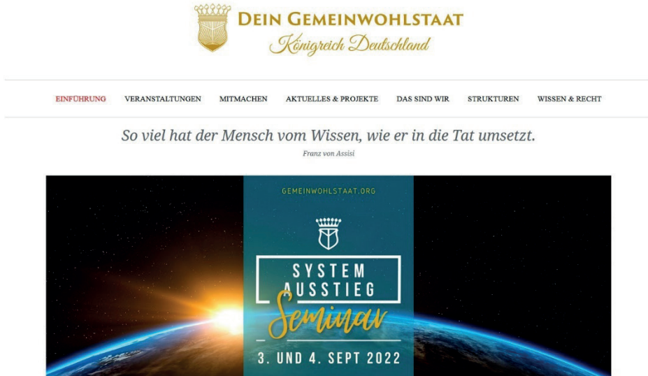
Abb. 4: Startseite „Königreich Deutschland“ mit Zitat von Franz von Assisi ( https://koenigreichdeutschland.org/de/ )

Abschließend sei die Domäne „Königreich Deutschland“ betrachtet. Bereits auf der Startseite findet sich als Leitspruch ein Zitat des Kirchenlehrers Franz von Assisi.