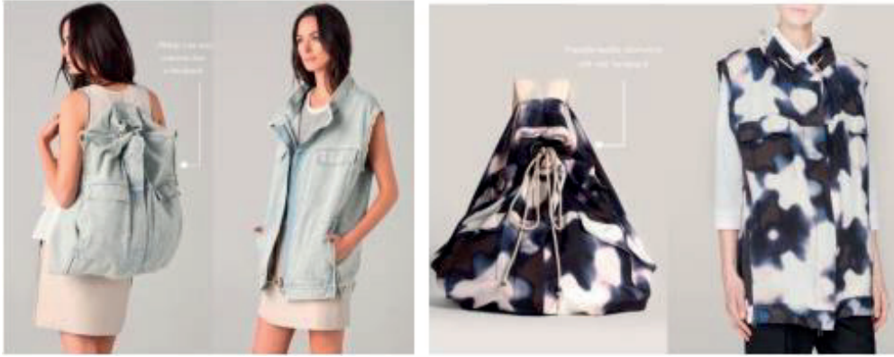
Şekil 1. Philip Lim, “Transformable Vest”,2012.

Giysi formu üzerinden yeniden amaçlandırmada yapılmadan yeni giysi algısı yaratılması için değişik bağlama, açma, kapama yöntemleri geliştirilmekte, kalıp üzerinde herhangi bir değişiklik yapılmamaktadır. Bu tarz ürünlerle kullanıcı giysileri tasarımcının öngördüğü şekilde farklı işlevlere sahip ürünlere veya başka bir giysi grubuna dönüştürerek kullanabilmektedir. Giysi formunun diğer bir pratik işlevi olan ürüne dönüşmesine “Transformable Vest” (dönüştürülebilir yelek) isimli tasarım örnek olarak verilebilmektedir. Philip Lim tarafından tasarlanan denim ve ipek kumaştan hazırlanan yelekler, kullanıcının isteği doğrultusunda belirlenen zamanda ve tasarımcının öngördüğü şekilde sırt çantasına dönüşerek kullanabilmektedir (Günbulut, 2018, s. 97) (Şekil 1).