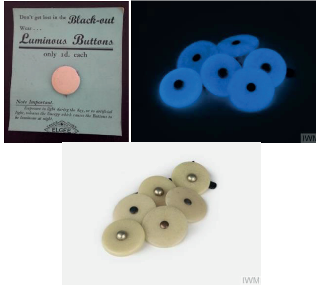
Şekil 22. Karanlıkta Parlaklık Sağlayan Düğmeler.

Çanta tasarımında olduğu gibi savaşın yarattığı sorunu ticari potansiyel olarak gören üreticiler, karanlıkta yanan düğmelerden iğneli çiçeklerine kadar kullanıcıların daha görünür olmasını sağlayacak aksesuarlar üretmişlerdir (Şekil 22-23).