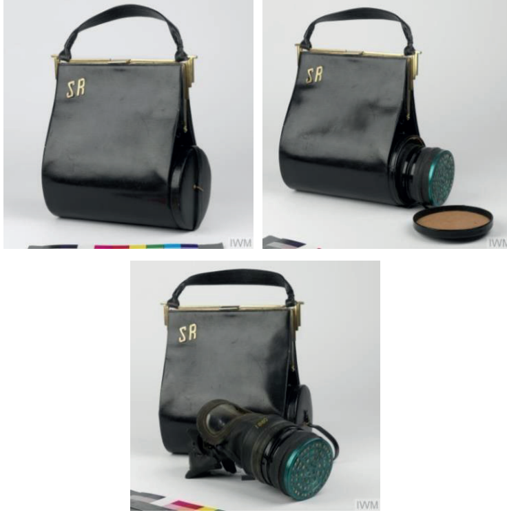
Şekil 20. Gaz Maskesini Taşımaya Yarayan Çanta Tasarımı.

yerleştirilmiş çanta tasarımını ortaya çıkarmışlardır (Şekil 20). Bu tasarım sayesinde çantanın genel kullanımı yanı sıra gerekli durumlarda maskeye kolayca ulaşımı sağlanmıştır.