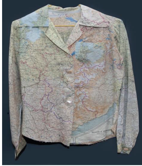
Şekil 10. Kuzey Avrupa Haritasından Yapılmış Bir Bluz, National Air and Space Museum, ABD.