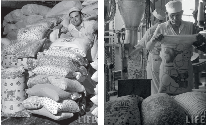
Şekil 3. Giysi Olarak Yeniden Amaçlandırılan Un ve Yem Torbaları.

Pamuk, yem ve un taşımada kullanılan çuvallar, kaliteli, uzun ömürlü ve farklı dönüşümler içeren bir döngü sürecine sahip olması nedeniyle yeniden amaçlandırma yönteminin en önemli kaynağı olmuştur (Adrosko, 1992, s. 130). İç çamaşırı, gömlek, etek, önlük vb. ihtiyaçlar bu çuvallardan karşılanmıştır (Jones and Park, 1993, s. 91). Başlarda çuvallar üzerindeki mürekkeple basılan logoları çıkarmak kullanıcılar tarafından zorlu hale gelse de ürünlerinin farklı amaçlarla kullanımından haberdar olan çuval üreticileri bu baskıları kaldırmış ve söküm işlemlerinin kolaylaşması adına çuvalların kenarlarını zincir dikişi ile tutturmuştur (Powell, 2012, s. 3) (Şekil 3).