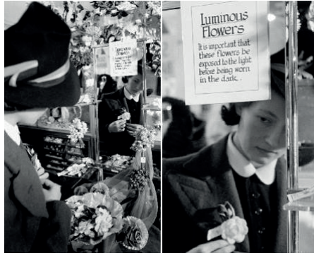
Şekil 23. Karanlıkta Parlaklık Sağlayan İğneli Sahte Yaka Çiçekler.