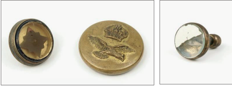
Şekil 24-25. İçinde Kaçış Pusulası Saklanmış Kraliyet Hava Kuvvetleri Üniformalarında Kullanılan Düğmeler.

İkinci Dünya Savaşı sırasında kaçış haritalarından sonra MI9 tarafından geliştirilen önemli ekipmanlardan biri de kaçış pusulalarıdır. Bu pusulalar çok çeşitli olarak üretilmiş ve üniformaların düğmelerinde saklanmıştır. Kraliyet Hava Kuvvetlerinin üniformalarında bulunan düğmelerin arkasındaki vidanın sökülmesiyle küçük pusula çarkı ortaya çıkmaktadır (Şekil 24). Diğer bir örnekte de kol düğmesinin cam yüzeyinin üzerinde yer alan düz beyaz boya silindiğinde kaçış pusulası ortaya çıkmaktadır (Şekil 25). Böylece düğmeler tehlike anlarında işlevini değiştirerek yeniden amaçlandırılmaktadır.