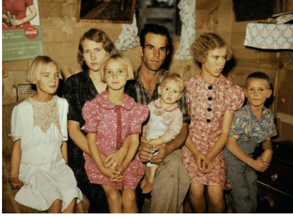
Şekil 5. (solda) Çocuklar İçin Un Torbalarından Yapılmış Giysiler.