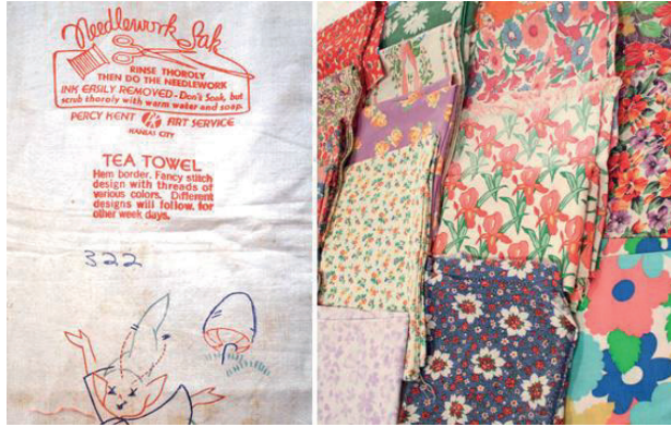
Şekil 4. Çeşitli Desenlerde Un ve Yem Torbaları.