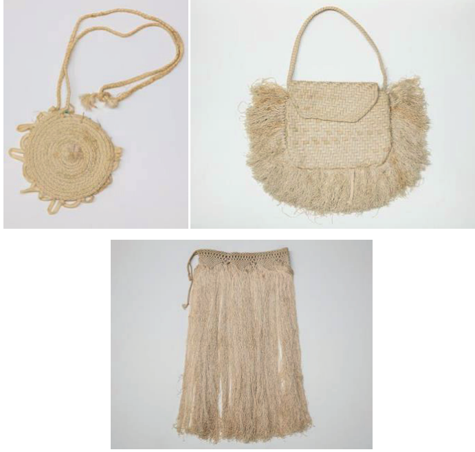
Şekil 19. ABD Donanması paraşüt malzemesinden yapılmış dokuma çantalar ve etek.

Savaş sonrası yapısı bozulan paraşütler değerli bir kumaş olarak sadece gelinliklerde kullanılmamış günlük yaşam için gerekli duyulan şeyleri yapmak için bir malzeme haline gelmiştir. New Orleans National WWII Museum'da yer alan ABD Donanması paraşüt malzemesinden yapılmış dokuma çantalar ve etek buna örnek olarak verilebilmektedir (Şekil 19).