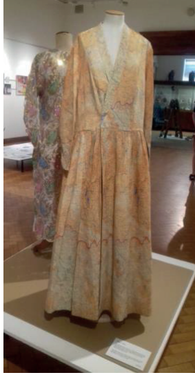
Şekil 9. "44 Serisi" de Yer Alan Fransa Haritasından El Dikişi İle Yapılmış Şal Yaka Elbise, Worthing Museum, İngiltere.

Buna ilk örnek olarak İngiltere'de "Worthing Museum" da sergilenen "44 Serisi" de yer alan Fransa haritası kullanılarak el dikişi ile yapılmış şal yaka elbise verilebilir (Şekil 9).