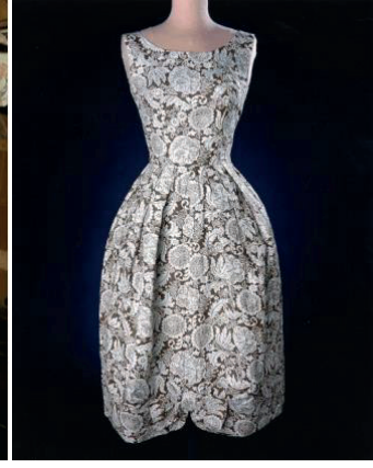
Şekil 6.(sağda) Dorothy Overall, Pamuk Torbası Dikiş Yarışmasında İkinci Olan Elbise, 1959.