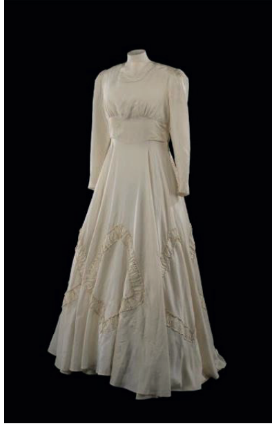
Şekil 14. Gena Turgel İçin Paraşüt İpeğinden Yapılan Gelinlik, Kraliyet Savaş Müzesi, İngiltere.