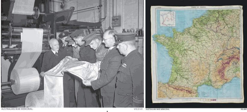
Şekil 7.(solda) Melbourne'da İpek RAAF Haritalarının Basımı.