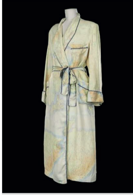
Şekil 12. Güneydoğu Asya Kaçış Haritasından Yapılan Sabahlık, Kraliyet Savaş Müzesi, İngiltere.