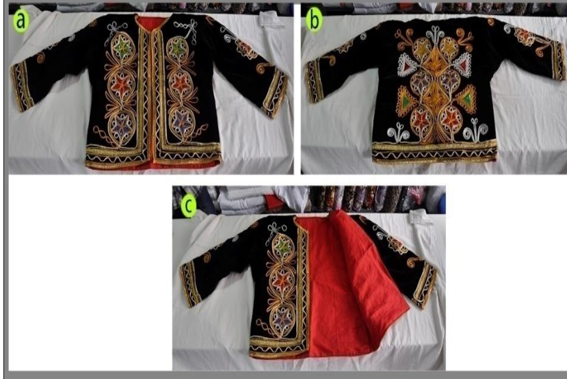
Fotoğraf 10. Salta'nın önden (a), arkadan (b) ve iç (c) görünümü, Sivas (2014)

(Photo 10. Front and rear view of the salta, Sivas (2014))