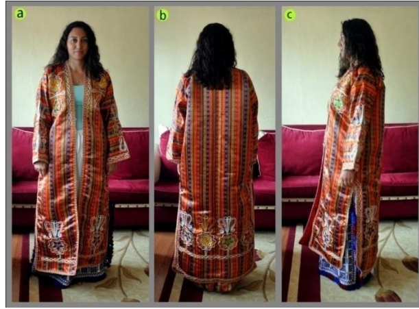
Fotoğraf 12. Üç eteğin önden (a), arkadan (b) ve yandan (c) görünümü, Sivas, (2014) (Photo 12. Front(a) and rear (b) view of the üç etek, Sivas (2014))