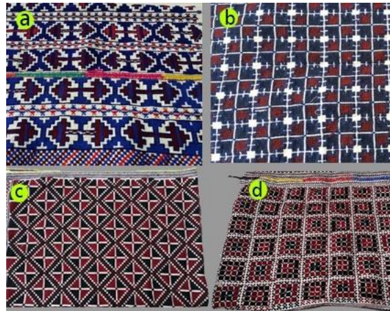
Fotoğraf 5. Göynek motifi örneği, a:kilim, b:kurtizi, c:üçkaya, d:şekerpare, Sivas (2014) (Photo 5. Samples of shirt, motif names, a:kilim, b:kurtizi, c:üçkaya, d:şekerpare, Sivas (2014))

Göynek: Erkek giyimindeki adı işlik, kadın giyiminde ise adı göynektir. Bu kıyafet, eskiden bezden veya çizgili kumaştan ve bedene göre uzun elbise şeklinde dikilmiştir. Günümüzde Amasya ilinde boyu kalça hizasında renkli, çiçekli pazen, basma ve patiska türü kumaşlardan hazırlanmaktadır. Tokat'ın Zile ilçesinde ise pazen ya da basma türü kumaş kullanılmaz, beyaz kumaşlara işlenir.