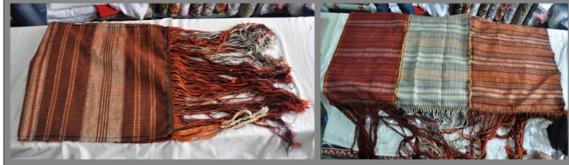
Fotoğraf 16. Püsküllü kuşak, Sivas (2014) (Photo 16. Fringed waistband, Sivas (2014))

Guşak, Arkalık: Yünlü kumaştan dokunan, çoğunlukla yaşlı kadınların bellerine sardıkları uzun bez giyecektir. Püsküllü kuşak 3 parçadan oluşur. Aşağıdaki fotoğraflarda püsküllü kuşağın dikilmemiş hali görülmektedir (Fotoğraf 16). Dikildikten sonra boncuk ve pul takılıp işlenir (Fotoğraf 17). Kuşağın üzerine takılan, uç kısmı püsküllü, yünden el tezgâhlarında dokunan giysidir. Sarı-kırmızı, beyaz-kırmızı, sarı-beyaz çizgili üçlü parçalar halinde, yan yana dikilerek, "oyulgama" ile hazırlanır. Arkadan sarkan ucuna 40-50 cm uzunluğunda saçak yapılıır. Diğer ucu 15-20 cm içe kıvrılarak, arasına bağ geçirilip, bele bağlanır. Kastamonu ilinin Tosya ilçesinde dokunur.