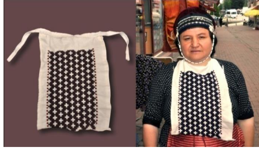
Fotoğraf 21. Yağlık / Yakalık örneği, Tokat-Zara (2015) (Photo 21. Samples of yağlık/yakalık Tokat-Zara (2015))

Yağlık, Yakalık: Bazı köylerde döşlük adıyla da bilinir. Kadınların boyunları ile göğüslerinin alt kısmı arasında takılan, genellikle beyaz renkli, ince kumaştan yapılan bir aksesuardır. Dış sayanın üstüne, boyun ve bel arasını kapatacak şekilde dikilir. Genellikle beyaz renkli kumaşlardan yapılır ve kenarları süslenir. Ön yakanın açık kısmından ve boyundan bağlanarak kullanılır. Kadınların göğüs kısmını kapatmak için kullanılır (Fotoğraf 21).