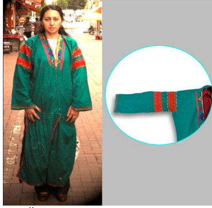
Fotoğraf 15. Üç-peşli örneği, Tokat-Zara (2015) (Photo 15. Üç etek fabric names, Tokat-Zara (2015))

Fotoğraf 15'de örnek olarak verilen üçpeşli'nin kollarında omuzluk olarak bilinen şerit kullanılmaktadır.