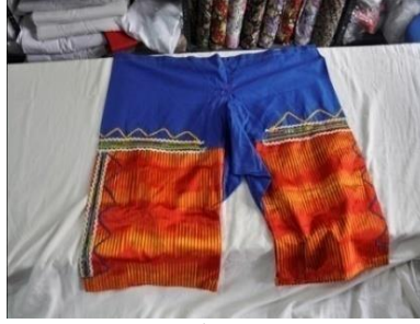
Fotoğraf 8. Tuman/Tıman, Sivas (2014) (Photo 8. Shalvar, Sivas (2014))

Tuman/Tıman: Sıraçlar arasında atlas adı verilen; kutnu, ipek veya basmadan dikilen kıyafettir. Tumanın/tımanın ağ kısmı kısadır. Üçgen şeklinde ek bir parça olan "ağ parçası" ile genişlik sağlanır. Bel ve paçalar uçkurlar ile büzdürülür. Astarlı dikilenleri de bulunur. Ama bu tür tuman/tıman giyildiğinde iç don kullanılmaz. Böylece diğer giyim parçalarının altından pek görülmez. Diz altına kadar inenleri de vardır. İki renklidir ve iki farklı kumaştan yapılmıştır. Alt tarafı kutnu üst tarafı pazendir. Terletmemesi için üst tarafı pazen olarak yapılmıştır. Günümüzde tek parça olarak da dikilmektedir (Fotoğraf 8 ve Fotoğraf 9).