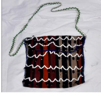
Fotoğraf 25. Tuzluk örneği Tokat-Zara (2015) (Photo 25. Sample of Tuzluk, Tokat-Zara (2015))

Aksesuarlar: Bilezik, gerdanlık, küpe, hameyli, tuzluk, saç bağı, yanaklık, beşibiryerde gibi aksesuarlar kullanılır (Fotoğraf 26). Kadınların kullandığı aksesuarlardan biri de karanfil hızmasıdır. Karanfil hızması eskiden alevi kadınların kimliğini belirlemek ve onları diğerlerinden ayırmak için kullanılan bir simgeydi, daha sonra takı amaçlı dekoratif olarak kullanıldı. Hızma genellikle yaşlı kadınlarda yaygın olarak kullanılmaktadır (Yıldırım, 2015).