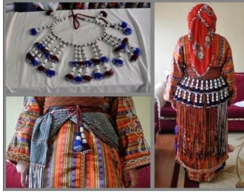
Fotoğraf 18. Bel bağı, Sivas (2014) (Photo 18. Waist band, Sivas (2014))

Arkabağ, Boncuklu Bel Bağı: Kimi Sıraç köylerinde "belbağı" olarak da bilinir. İnce beyaz boncuğun arasına göz boncuğu konulur; mavi, beyaz, lacivert ve kırmızı renklerden, ucu saçaklı, bele bağlanan süs eşyasıdır. Büyük boy mavi ve beyaz boncuklar yün iplere dizilerek, çeşitli uzunluklarda saçaklar hazırlanır. Hazırlanan saçakların alt ucunda kalan yün ipler çoğaltılır ve püskül haline getirilir. Püskül ipliklerin her birine küçük ve renkli boncuklar bağlanır ve dikilir. Yünden örülen kolan üzerine saçaklar yan yana getirilerek tutturulur. Kolan bele dolanarak bağlanır. Boncuklu bel bağı, arkalığın üzerine gelecek şekilde giyilir. Püskül kuşağın en üstüne bağlanır. Yöreye göre püskülde farklılıklar olabilir (Fotoğraf 18).