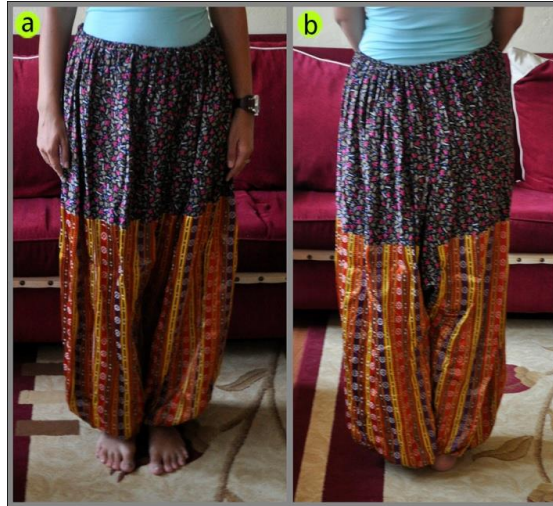
Fotoğraf 9. Tumanın/Tımanın önden (a) arkadan (b) görünümü, Sivas (2014)

(Photo 9. Front and rear view of the shalvar, Sivas (2014))