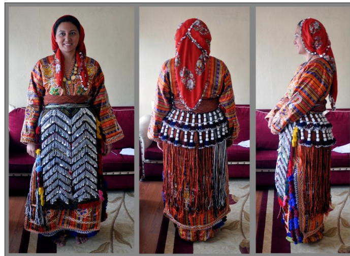
Fotoğraf 22. Sıraç Kadın Giyimi, Sivas (2014) (Photo 22. Sıraç Women's Clothing, Sivas (2014))

Yağlık, Yakalık: Bazı köylerde döşlük adıyla da bilinir. Kadınların boyunları ile göğüslerinin alt kısmı arasında takılan, genellikle beyaz renkli, ince kumaştan yapılan bir aksesuardır. Dış sayanın üstüne, boyun ve bel arasını kapatacak şekilde dikilir. Genellikle beyaz renkli kumaşlardan yapılır ve kenarları süslenir. Ön yakanın açık kısmından ve boyundan bağlanarak kullanılır. Kadınların göğüs kısmını kapatmak için kullanılır (Fotoğraf 21).