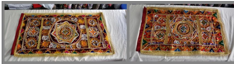
Fotoğraf 19. Öynük örneği, Sivas (2014) (Photo 19. Samples of apron, Sivas (2014))

Öynük: Üzerindeki nakışlar ve işlemler bakımından bir halı kadar kıymetli, kadın kıyafetlerinin göze ilk çarpan örtüsüdür. Üzerindeki motiflere göre, köy adlarıyla anılan çeşitleri vardır. Kadının iş yaparken önünün kirlenmemesi ayrıca önünün açılmaması ve içinin gözükmemesi yani ön tarafını örtmek için kullanılır. İlkel el tezgâhlarında dokunanlarına "şal öynük" denir. Şal öynüklerde "suyu", "gölü" ve "ay nakışı" motifleri bulunur. Tokat ve çevresinde hâlâ konar-göçer tezgâhlarda yün iplerle dokunan işlemeli ve basma türü kumaş önlükler kullanılır. Dokuma önlük, dokuma sırasında işlenir. Dokuma tezgâhının eni dar olduğu için, iki parça yan yana dikilerek, dikdörtgen şeklinde hazırlanır. Boyu dış sayadan kısadır. Uçlarına yün örme kuşak veya "kolan" dikilir. Kumaştan dikilen simli veya parlak önlükler, jarse ve basma gibi kumaşlarla astarlanır. Kadife üç peşlerin süslemesi gibi, tek renk kumaşlarla kenarları süslenir. Bir metre kumaştan dikilen önlük, yine kumaştan hazırlanan bel bağı ile kullanılır (Fotoğraf 19 ve Fotoğraf 20).