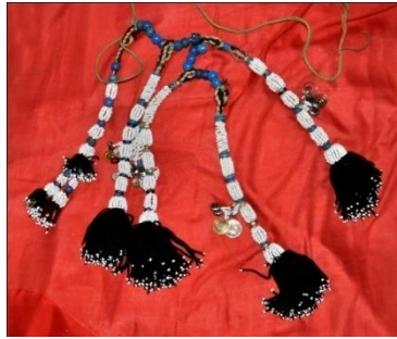
Fotoğraf 3. Saç bağı örneği, Tokat-Zara (2015) (Photo 3. Sample of Hairbond, Tokat-Zara (2015))

Çene Bağı/Çenelik: Fesin düşmemesi, sabit durması için, şakak kısmına dikilen ip, arkadan saçların altından geçirilerek tutturulur veya boncuklarla hazırlanan oya yine şakak kısmına dikilerek, çene altından geçirilir (Fotoğraf 2).