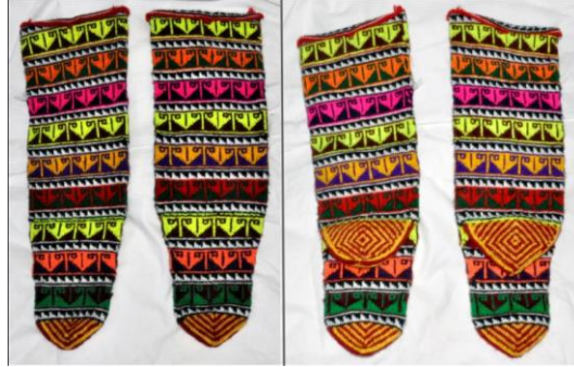
Fotoğraf 23. Çorap örneği, Tokat-Zara (2015) (Photo 23. Sample of Socks, Tokat-Zara (2015))

Çorap: Erkek giyimindeki alaca çorabın aynısıdır. Kadınlar da giyerler. El örgüsü olarak evlerde dokunan bu çorapların renklilerine "alaca" denir. Genellikle kırmızı renkli iplikler baskın olan çoraplara; sarı, beyaz, mavi renklerle nakış yapılır. Bu nakışlar "aynalı, oymalı, koyuk, bermak, makaslı, kilim ve kara yazma" gibi isimlerle anılır(Görsel 23).Renkler eldeki olanaklara göre seçilmekle birlikte, erkekler genellikle siyah ya da beyaz renkleri; kadınlar ise çift renkleri kullanırlar. Düz örülen çoraplara "şal çorap" denir.