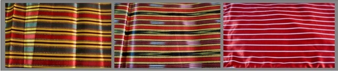
Fotoğraf 13. Darıca (sarılı kutnu), Karalı kutnu/Bindallı, Kamah ağalı, çubuklu kutnu), Sivas (2014) (Photo 13. Üç etek fabric names Darıca (sarılı kutnu), Karalı kutnu/Bindallı, Kamah (ağalı, çubuklu kutnu), Sivas (2014))