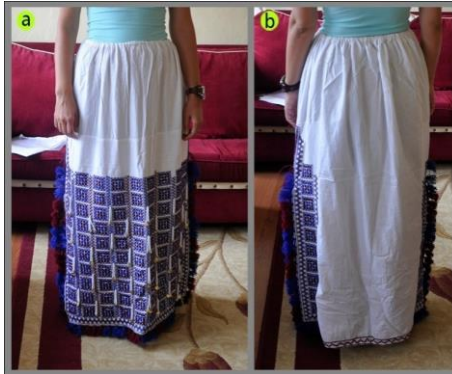
Fotoğraf 7. Göynek önden (a), arkadan (b) görünümü, Sivas (2014) (Photo 7. Front and rear view of the shirt, Sivas (2014))

Beyaz etamin veya pamuklu kumaşlardan dikilen ve eskiden uzun elbise olarak yapılan göynek, günümüzde etek altlarına giyilen ve jüpon görevi gören iç eteğe denilmektedir. Boyu 70-75 cm civarında olup, bel kısmı uçkurludur. Yanlarda 15-20 cm boyunda yırtmaçlar bulunur. Etek ucu ile yırtmaç hizasında kalan kısım etamin işi veya basit nakış teknikleri ile süslenir. Yırtmaç kenarları kaytan veya harçlarla temizlenir. Eskiden kadınlar künt işi yaparlarmış. Alt tarafında püskül ve pullar vardır. Arka kısmında yanlar etamin, ortası ise hasa bezidir. Etamin olan kısımların üzerine işleme yapılır (Fotoğraf 7).