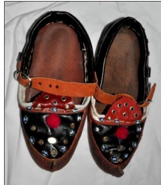
Fotoğraf 24. Aynalı çarık örneği, Tokat-Zara (2015) (Photo 24. Sample of Aynalı Sandal, Tokat-Zara (2015))

Çarık, Ayakkabı: Erkek kıyafetlerinde anlatıldığı gibidir. Kadınlar; sarı, kırmızı gibi sıcak renklerle süslenmiş olanlarını tercih ederler. Günümüzde çarık giyen hemen hemen hiç yok gibidir. Fakat eskiden çarık, yemeni, Laçın ve mest gibi giyecekler ayağa giyilmekteymiş. Ama günümüzde genellikle kara lastik, plastik ayakkabılar ve kunduralar giyilmektedir. Kadınlar gelin olurken genellikle ayaklarına aynalı çarık giyerler (Fotoğraf 24).