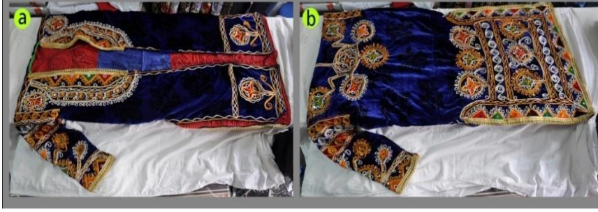
Fotoğraf 11. Kadife üç etek önden (a) ve arkadan(b) görünümü, Sivas (2014) (Photo 11. Front(a) and rear (b) view of the velvet, Sivas (2014))