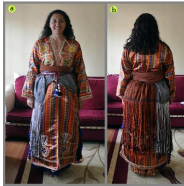
Fotoğraf 17. Kuşağın önden (a) ve arkadan (b) görünümü, Sivas (2014) (Photo 17. Front (a) and rear (b) view of the waistband, Sivas (2014))