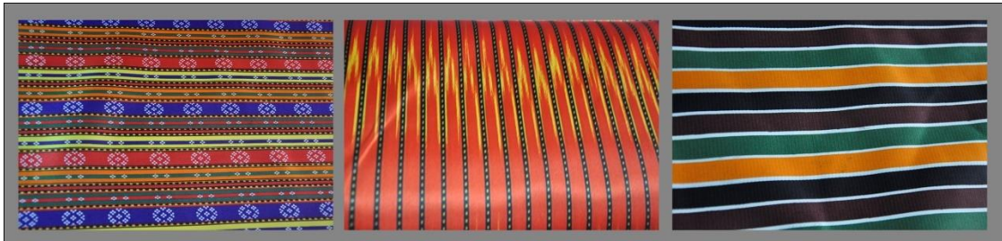
Fotoğraf 14. Mecidiye, Zincirli, Altıparmak, Sivas (2014) (Photo 14. Üç etek fabric names Mecidiye, Zincirli, Altıparmak, Sivas (2014))