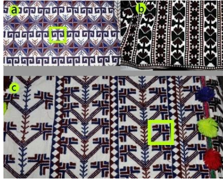
Fotoğraf 6. Göynek motifi örneği, a: koçboynuzu, b:kara yazma, c: kazayağı, Tokat-Zara (2015) (Photo 6. Samples of shirt motif names, a: koçboynuzu, b:kara yazma, c: kazayağı, Tokat-Zara (2015))

Elbise şeklinde dikilen göynek iki parçadır. Kol altından bele kadar genişliği vermek için, "yan" ya da "genişlik" adı verilen parça dikilir. Yaka "V" kesimlidir ve açıklığı göğüs altına kadar uzanır. Kolları bol ve bileğe kadar gelir. Yakaları işlenmiş olanları da vardır. Göynek desenleri çıtırık, akça, kilim, kara yazma, kurt izi, şekerpare, kazayağı, keser ağzı, koçboynuzu, uçkaya olarak sıralanabilir (Fotoğraf 5 ve Fotoğraf 6). Koçboynuzu isimli göynek deseninde bulunan motif, koçboynuzuna benzediği için bu ismi almıştır. Benzer bir yaklaşımla kazayağı isimli göynek deseninde bulunan motif, kazın ayağına benzemesi nedeniyle bu ismi almıştır (Fotoğraf 6 a ve fotoğraf 6 c). "Köy Alevileri, özellikle Tahtacı'lar üç parmakla gösterilen ve kazayağı dedikleri bir işaret yaparlar. Bu işaret Allah-Muhammed-Ali üçlemesini simgeler" (Alkan, 2005:37).