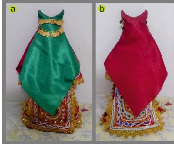
Fotoğraf 4. Duvağın önden(a) ve arkadan (b) görünümü, Tokat-Zara (2015) (Photo 4. Front and rear view of the veil Tokat-Zara (2015))

Alınlık: Fesin ön tarafına takılan ve gerdanlığa benzeyen altın, gümüş veya çeşitli madenlerden yapılan süslemedir. Eskiden Tokat'ın Zile ilçesinde gelin evden çıkmadan önce, duvağın üzerine bağlanırdı. Duvağın önü yeşil arkası kırmızı renkte olurdu, alınlık gümüş küçük paralardan oluşmaktaydı (Fotoğraf 4).