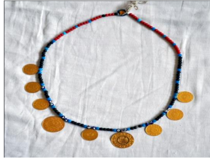
Fotoğraf 26. Beşibiryerde örneği, Sivas (2014) (Photo 26. Sample of Beşibiryerde, Sivas (2014))

Aksesuarlar: Bilezik, gerdanlık, küpe, hameyli, tuzluk, saç bağı, yanaklık, beşibiryerde gibi aksesuarlar kullanılır (Fotoğraf 26). Kadınların kullandığı aksesuarlardan biri de karanfil hızmasıdır. Karanfil hızması eskiden alevi kadınların kimliğini belirlemek ve onları diğerlerinden ayırmak için kullanılan bir simgeydi, daha sonra takı amaçlı dekoratif olarak kullanıldı. Hızma genellikle yaşlı kadınlarda yaygın olarak kullanılmaktadır (Yıldırım, 2015).