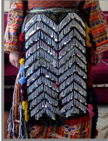
Fotoğraf 20. Öynük örneği, Sivas (2014) (Photo 20. Samples of apron, Sivas (2014))