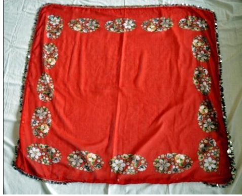
Fotoğraf 1. Örtü, çit örneği, Sivas (2014) (Photo 1. Cover, sample of çit, Sivas (2014))

Örtü, Çit: Üzerinde çeşitli süsler ve motifler bulunan başörtüsüdür. Fesin üzerine beyaz ya da farklı renkte ince tülbenkten, etrafı filkete ile yapılan, pul oyası dikilerek hazırlanan örtüdür. Elmalı gibi, üçgen şeklinde katlanarak başa giyilir. Üçgen şeklinde olmasının nedeni, başa kolay bağlanmasıdır (Fotoğraf 1).