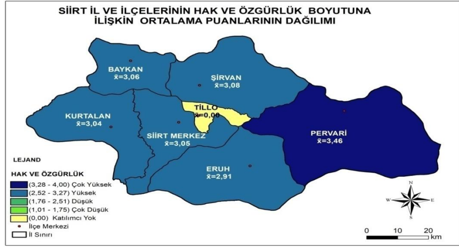
Şekil 3. Siirt İli ve İlçelerinin Hak ve Özgürlükler Boyutuna İlişkin Ortalama Puanlarının Mekânsal Dağılımı

Şekil 3'te görüldüğü üzere ortaöğretim kurumu öğrencilerinin vatandaşlığa ilişkin algılarının “hak ve özgürlükler” boyutuna göre en yüksek olduğu ilçe Pervari ( \bar{X} = 3.46 ) iken; en düşük olduğu ilçe Eruh ( \bar{X} = 2.91 ) olmuştur. Başka bir deyişle “hak ve özgürlükler” boyutunda öğrencilerin vatandaşlık algılarının en yüksek olduğu ilçeden en düşük olduğu ilçeye göre sıralaması Pervari ( \bar{X} = 3.46 ), Şirvan ( \bar{X} = 3.08 ), Baykan ( \bar{X} = 3.06 ), Siirt merkez ( \bar{X} = 3.05 ), Kurtalan ( \bar{X} = 3.04 ) ve Eruh ( \bar{X} = 2.91 ) şeklindedir.