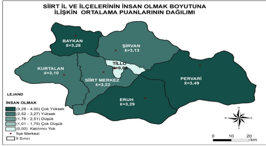
Şekil 1. Siirt İli ve İlçelerinin İnsan Olmak Boyutuna İlişkin Ortalama Puanlarının Mekânsal Dağılımı

Şekil 1’de görüldüğü gibi ortaöğretim kurumu öğrencilerinin vatandaşlığa ilişkin algılarının “insan olmak” boyutuna göre en yüksek olduğu ilçe Pervari ( \bar{X} = 3.49 ) iken; en az düşük olduğu ilçe Kurtalan ( \bar{X} = 3.10 ) olmuştur. Başka bir anlatımla “insan olmak” boyutunda öğrencilerin vatandaşlık algılarının en yüksek olduğu ilçeden en düşük olduğu ilçeye göre sıralaması Pervari ( \bar{X} = 3.49 ), Eruh ( \bar{X} = 3.29 ), Baykan ( \bar{X} = 3.28 ), Siirt merkez ( \bar{X} = 3.22 ), Şirvan ( \bar{X} = 3.13 ) ve Kurtalan ( \bar{X} = 3.10 ) şeklindedir.