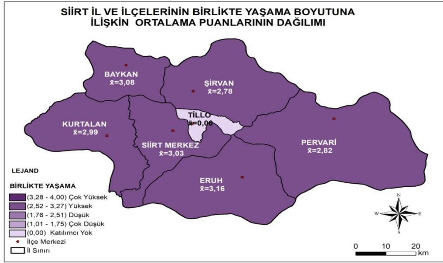
Şekil 5. Siirt İli ve İlçelerinin Birlikte Yaşama Boyutuna İlişkin Ortalama Puanlarının Mekânsal Dağılımı

Şekil 5'te görüldüğü gibi ortaöğretim kurumu öğrencilerinin vatandaşlığa ilişkin algılarının "birlikte yaşama" boyutuna göre en yüksek olduğu ilçe Eruh ( \bar{X} = 3.16 ) iken; en düşük olduğu ilçe Şirvan ( \bar{X} = 2.78 ) olmuştur. Başka bir anlatımla "birlikte yaşama" boyutunda vatandaşlık algısının en yüksek olduğu ilçeden en düşük olduğu ilçeye göre sıralaması Eruh ( \bar{X} = 3.16 ), Baykan ( \bar{X} = 3.08 ), Siirt merkez ( \bar{X} = 3.03 ), Kurtalan ( \bar{X} = 2.99 ), Pervari ( \bar{X} = 2.82 ) ve Şirvan ( \bar{X} = 2.78 ) şeklindedir.