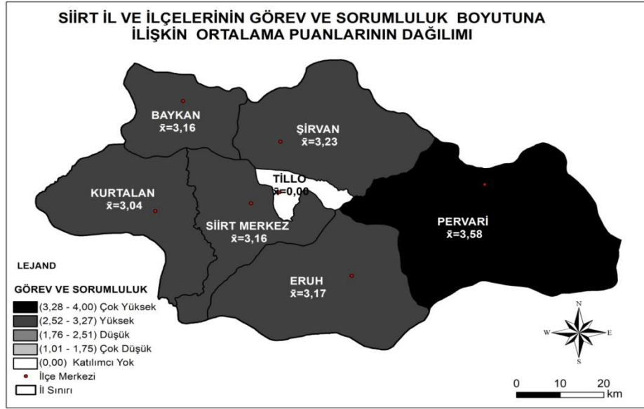
Şekil 2. Siirt İli ve İlçelerinin Görev ve Sorumluluk Boyutuna İlişkin Ortalama Puanlarının Mekânsal Dağılımı

Şekil 2’de görüldüğü gibi ortaöğretim kurumu öğrencilerinin vatandaşlığa ilişkin algılarının “görev ve sorumluluk” boyutuna göre en yüksek olduğu ilçe Pervari ( \bar{X}=3.58 ) iken; en düşük olduğu ilçe Kurtalan ( \bar{X}=3.04 ) olmuştur. Başka bir anlatımla “görev ve sorumluluk” boyutunda öğrencilerin vatandaşlık algılarının en yüksek olduğu ilçeden en düşük olduğu ilçeye göre sıralaması Pervari ( \bar{X}=3.58 ), Şirvan ( \bar{X}=3.23 ), Eruh ( \bar{X}=3.17 ), Baykan ( \bar{X}=3.16 ) / Siirt merkez ( \bar{X}=3.16 ) ve Kurtalan ( \bar{X}=3.04 ) şeklindedir.