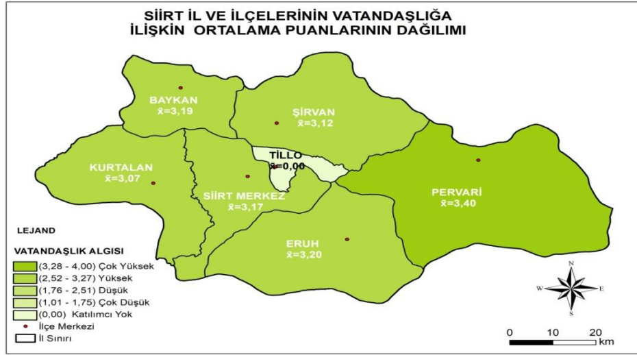
Şekil 6. Siirt İli ve İlçelerinin Vatandaşlığa İlişkin Ortalama Puanlarının Mekânsal Dağılımı

Şekil 6’da görüldüğü gibi ortaöğretim kurumu öğrencilerinin vatandaşlığa ilişkin algılarının en yüksek olduğu ilçe Pervari ( \bar{X}=3.40 ) iken; en düşük olduğu ilçe Kurtalan ( \bar{X}=3.07 ) olmuştur. Başka bir anlatımla öğrencilerin vatandaşlığa ilişkin algılarının en yüksek olduğu ilçeden en düşük olduğu ilçeye göre sıralaması Pervari ( \bar{X}=3.40 ), Eruh ( \bar{X}=3.20 ), Baykan ( \bar{X}=3.19 ), Siirt merkez ( \bar{X}=3.17 ), Şirvan ( \bar{X}=3.12 ) ve Kurtalan ( \bar{X}=3.07 ) şeklindedir.