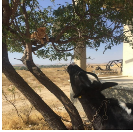
K63'ün Babasıyla Diktiği Badem Ağacı