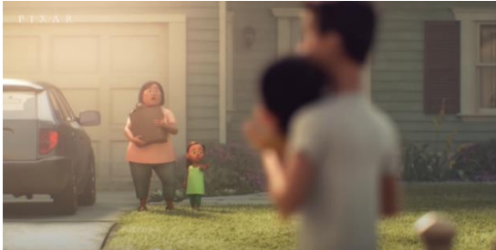
Şekil 5. Diğer Yetişkinlerin Tepkisi