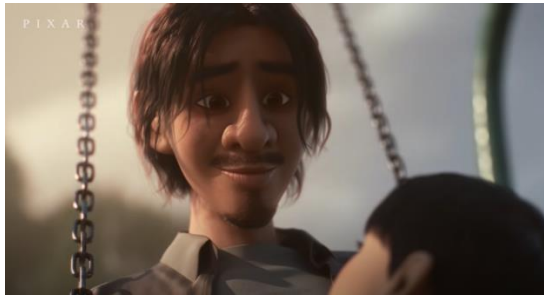
Şekil 20. Babanın Oğlunu Kabulü