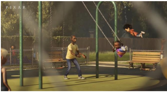
Şekil 12. Parkta Uçma Sahnesi