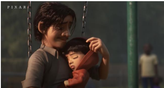
Şekil 18. Salıncağa Oturmaları ve Babanın Yüz İfadesi