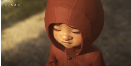
Şekil 16. Babasının Bağırmasına Ağlaması