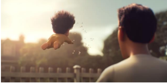
Şekil 1. Bebeğin İlk Uçuşu