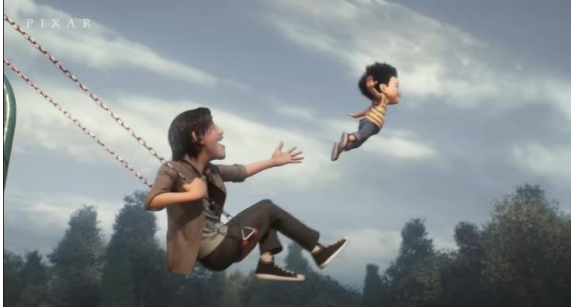
Şekil 22. Babanın Oğlunun Uçmasını Desteklemesi