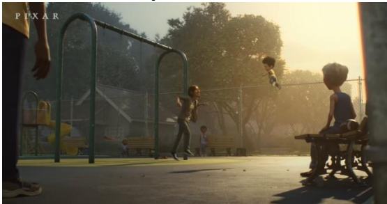
Şekil 24. Birlikte Mutlulukla Oyun Oynamaları