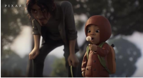
Şekil 10. Yolda Bulduğu Karahindiba Çiçeğini Üflemesi