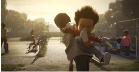
Şekil 14. Babanın Sürükleyerek Çocuğu Parktan Çıkarmaya Çalışması