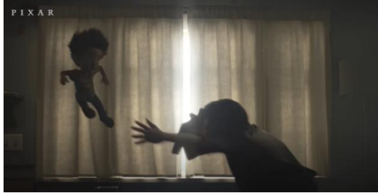
Şekil 8. Paltosunu Giydirmek İçin Yakalamaya Çalışması