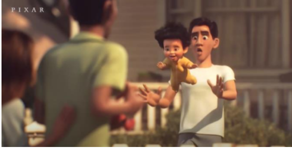
Şekil 3. Bebeğin Babasının Kucağından Uçuşu