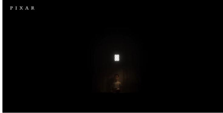
Şekil 7. Babanın Çaresizliği

Ekran tamamen kararır ve yeni sahne başladığında aradan yıllar geçmiştir. Baba farklı görünmektedir. Saçları uzun, mutsuz ve yorgun bir hali vardır. Ev dağınık, duvarlar çocuğun yaptığı çizimler ve resimlerle dolu haldedir. Animasyon, çocuğun uçar vaziyette evin tavanına resim çizmesiyle sürdürülmüştür. Çocuk evin tavanına resim çizerken o sırada babası çocuğu ayak bileğinden tutarak aşağı sertçe çeker ve elinden boya kalemini alır. Çocuğa paltosunu gösterir ve “hı hı hı” diyerek sevimli bir ses tonu kullanıp, paltosunu giymesini ister. Çocuk babasından uçarak kaçmaya çalışır ve başıyla hayır işareti yapar. Babası da evin içinde onu yakalamaya çalışır. Sonraki sahnede babanın elinde kedi figürlü bir balon olduğu görülür. Derin bir iç çeker. Yerde bir kova dolusu farklı boyutlarda taş vardır. Baba o taşlardan teker teker alır ve oğlunun sırt çantasına doldurur. Babanın koyduğu her taş ağırlık yapmaktadır ve çocuğun zemine yaklaşmasını sağlar. Çocuğunun uçmasını engelleyebilmek amacıyla taş dolu bir sırt çantası taşıtmaktadır. Bu sırada çocuğun yüz ifadesi mutsuz, isteksiz ve keyifsiz olarak gösterilmektedir. Çocuğun saçlarını kullanarak uçmasını engelleyebilmek amacıyla da paltosunun kapüşonunu sıkı sıkıya kapatır. Çocuk paltosunun yakasını çekiştirerek bundan rahatsız olduğunu ifade eder. Babanın paltosunu giydirmek için oğlunu yakalamaya çalışması ve sırt çantasını taşlarla doldurması animasyon filmi sahneleri Şekil 8 ve Şekil 9’da sunulmuştur.