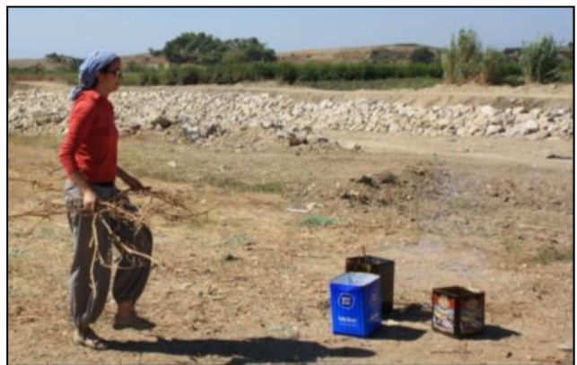
Resim 3: Yakma İşlemi İçin Kullanılan Teneke Kaplar