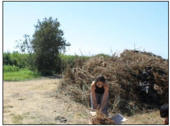
Resim 2: Kuru Dalların Yabancı Maddelerden Ayıklanması

Ayıklanmış dalların yakma işlemi dış mekânda, geniş ağızlı teneke kaplarda yapılıp (Resim 3), soğumaya bırakılmıştır.