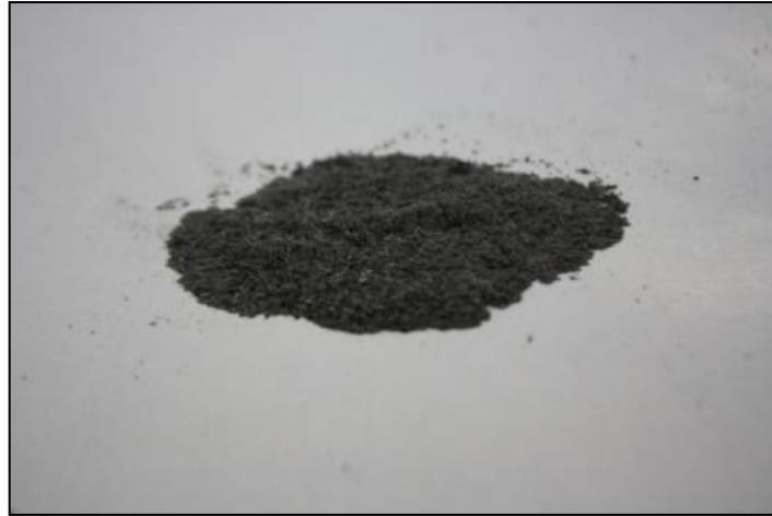
Resim 5: Elenmiş Kül