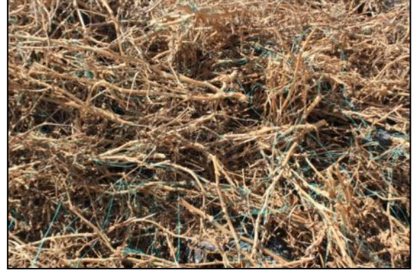
Resim 1: Sera Atığı, Kurumuş Patlıcan Dalları