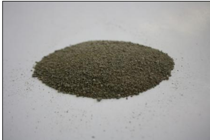
Resim 6: Isıl İşlem (Kalsinasyon) Sonrası Elde Edilen Kül