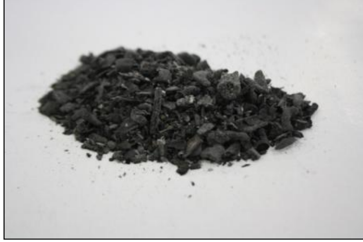
Resim 4: Yakma İşlemi Ardından Elde Edilen Kül

Elde edilen küller (Resim 4) elendikten sonra (Resim 5) bisküvi pişirimi yapılmış şamot kaplar içerisinde, kamara tipi elektrikli fırında, 900-920 0 C'de kalsine edilmiştir. Isıl işleme tabi tutulan küllerde %40-45 oranında kayıp olduğu gözlenmiştir.