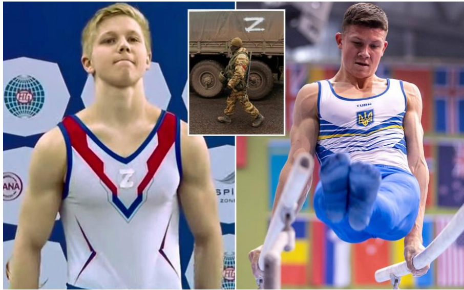
Resim 2. Rus Sporcu Ivan Kuliak'ın Formasına İliştirdiği Savaş Sembolü “Z” Harfi (Dailymail, 2022).

Euronews (2022) ve The Guardian (2022)'da konuyla ilgili yer alan haberlerde;