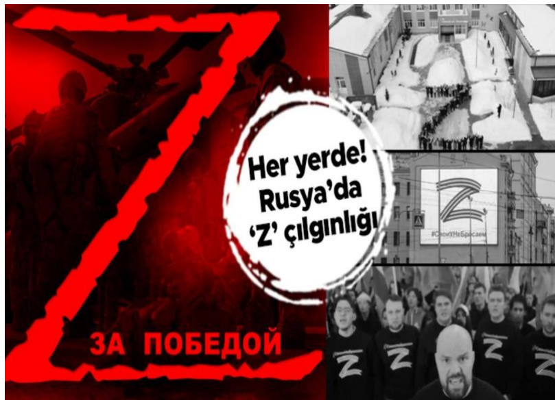
Resim 1. Rusya'nın "Z" harfi sembolü (Hürriyet, 2022).

Özellikle sosyal medyada ortaya çıkan sembol, kökenleri içerisinde bir gizemi barındırmaktadır ancak bununla ilgili birkaç teori öne sürülmüştür: