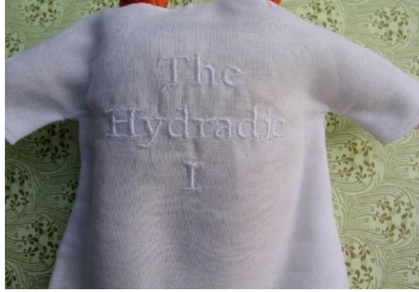
Resim 2. "The Stranger/The Hydradic I." Çift Taraflı Elbise.