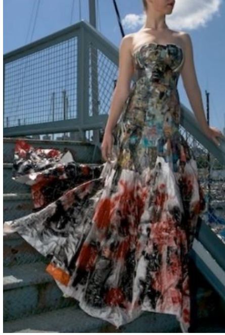
Resim 4. Geri Dönüştürülmüş Malzemeden Tasarlanan Elbise.