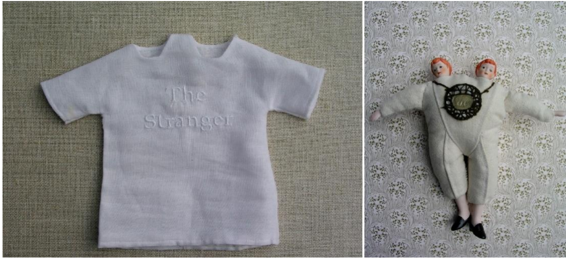
Resim 1. “The Stranger/The Hydradic I”, Çift Taraflı Elbise - Çift Başlı Figür.

Barney (2009), çalışmasını yürütmek üzere bulunduğu bölgede belirlediği kriterlere uygun bir okul seçmiştir. Araştırmasına başlamak için okula gittiğinde ilk tanışma esnasında katılımcı öğrenci grubuna kendisiyle ilgili görüşlerini hiçbir çekinceleri olmadan isimsiz olarak kağıda dökmelerini istemiştir. Öğrenciler onu “ilginç, enerjik, tuhaf” vb. gibi farklı sıfatlarla tanımlamışlardır. Barney bu süreçte hem öğrencilerin kendisiyle ilgili ilk izlenimlerini dışavurmalarını sağlamış hem de kendisiyle ilgili sorgulamalar yapmıştır. Bu sorgulamalar sırasında benlik, ego, küçük düşme, aşağılanma gibi konular üzerinde yeni perspektifler edindiğini ifade eden Barney süreç içinde çift taraflı ve çift başlı bir elbise figürü ortaya koyarak benliğin çoklu olasılıklarına işaret etmektedir. Ortaya çıkan çift başlı figür, ilişkisel bir birleşmeyi ve yansıtmayı, benliğin çoklu olasılıklarına yönelik bir arayışı ifade etmektedir (Resim 1.).