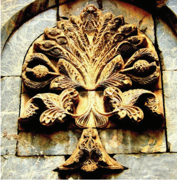
RESİM 1 • Sivas Gök Medrese Hayat Ağacı (29).