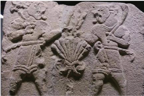
RESİM 2 • Aslantepe Ortostati. Aslantepe/Malatya M.Ö. 1200-700 dönemine ait hayat ağacı tasvirinin etrafındaki kılıçlı aslan figürleri (31).

Uçmak ağacı, ruhun taşıyıcısıdır. Aynı zamanda hayat ağacı iyilerin, ulu insanların dünyaya geldikleri yer olarak tasvir edilir. Tuba ağacı da bazen hayat ağacı olarak betimlenmiştir.