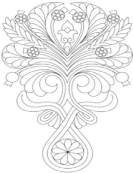
RESİM 3 • Eşrefoğlu Camii taçkapı kilit taşındaki "Hayat Ağacı" motifinin çizimi (28).

Antik çağlara ait kültür ve inanışların izini taşıyan ve günümüze kadar gelen Anadolu Medeniyetlerinin sanat eserlerinde Hayat ağacının farklı figürlerle temsil edildiği görülmektedir. Halk inançlarının eski izleri ile beraber "evrenin direği, barışın, bereketin, bilimin, hikmetin, kudretin ve sonsuzluğun sembolü" olarak hayat ağacı taş bezeme sanatındaki muazzam örneklerinde yerini almaktadır.