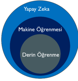
Şekil 2 – Yapay zeka, makine öğrenmesi ve derin öğrenme ilişkisi

Oldukça klasik bir örnek üzerinden giderek, kediler ve köpekler arasındaki farkın öğretilmesi ve sonrasında bu iki tür hayvandan birisi kendisine gösterildiğinde gördüğü hayvanın kedi mi yoksa köpek mi olduğunu doğru şekilde tespit edebilecek bir yapay zekâ teknolojisi düşünelim. Makine öğrenmesine dayalı bu tür bir sınıflandırma modellemesinde, makineye kedi ve köpek fotoğraflarından oluşan ayrı ayrı iki veri seti yüklenirken kullanıcı tarafından bazı öznitelikler belirlenir. Örneğin, kullanıcı, bu iki hayvanı ayırmak bakımından yazılımın kullanabileceği öznitelikleri, kafaya oranla kulak büyüklüğü veya kulak şekli olarak belirleyebilir. Kendisine verilen eğitim setini bu öznitelikler çerçevesinde çalışan makine öğrenmesi algoritması, sonrasında kendisine verilen bir fotoğrafı aynı özniteliklerden yola çıkarak sınıflandırabilir. 6