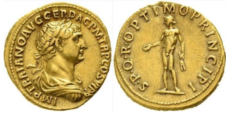
Res. 12: Genius. ( http://numismatics.org/ocre/id/ric.2.tr.275_aureus 08.11.2019).