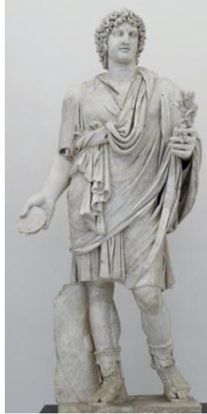
Res. 6: Genius Populi Romani Heykeli. Napoli Ulusal Arkeoloji Müzesi (Akçay 2019, res. 5).