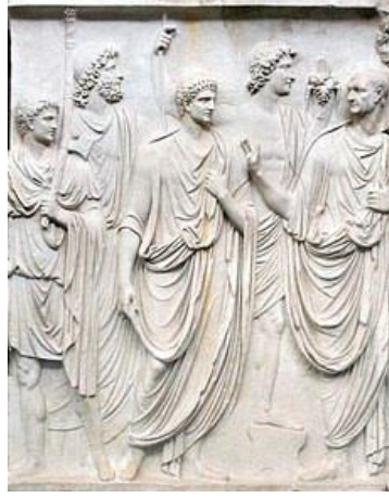
Res. 9: Genius Senatus ve Genius Populi Romani kişileştirmeleri (Cancelleria Rölyepleri - www.Rome101.com 08.11.2019).