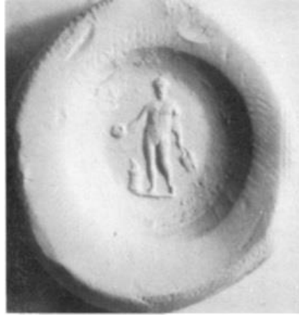
Res. 13: Bonus Eventus kişileştirmesi (Hening 1947, 71, plt. 1.)