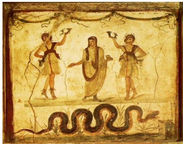
Res 1: Vettii evi lararium da ki Genius ve Lares kişileştirmeleri, Pompei, İtalya. ( http://ancientrome.ru/art/artworken/img.htm?id=1278 ).