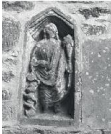
Res. 7: Genius Loci. St. Giles kilisesinin güney duvarı (Akçay 2019, res. 3).