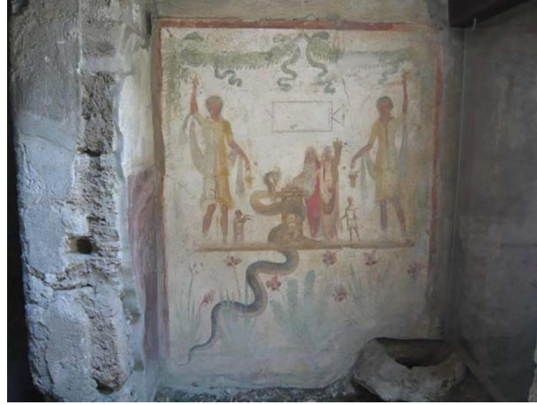
Res 2: Lares ve Genius kişileştirmeleri, Julius Polybius'un evi, Pompei.( http://www.pompeiiinpictures.com/pompeiiinpictures/r9/9%2013%2003%20p17.htm )