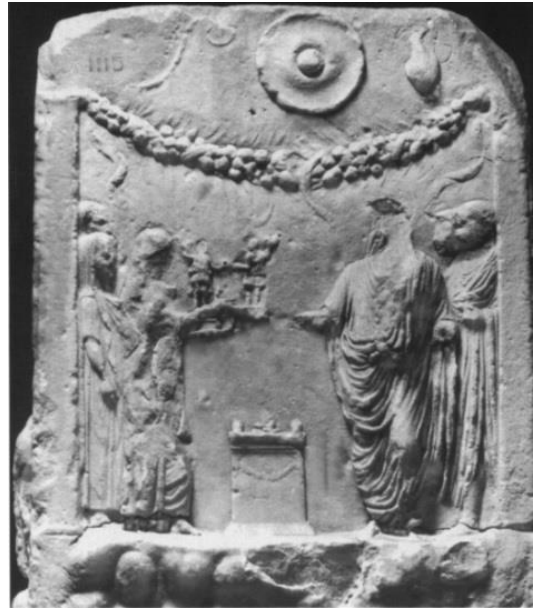
Res. 3: Belvedere Altarı, Lares Augusti (Pollini 2008, 401, res. 8).