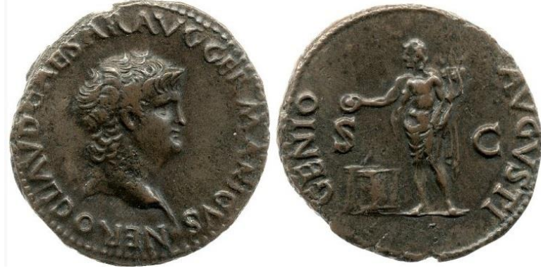
Res. 11: Genius Augusti ( https://numismatics.org/ocre/id/ric.1(2).ner.419 15. 09.2022).