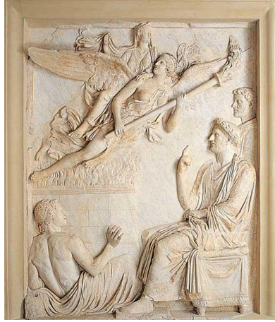
Res. 5: Genius (Juno) ve Genius Senatus. Sabina'nın apotheosisi (D.E.E. Kleiner 1992, res. 222.)