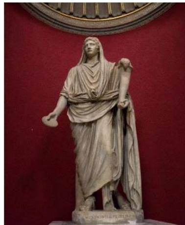
Res. 4: Genius Augusti. Vatikan Müzesi (Akçay 2019, 96, res. 2.).