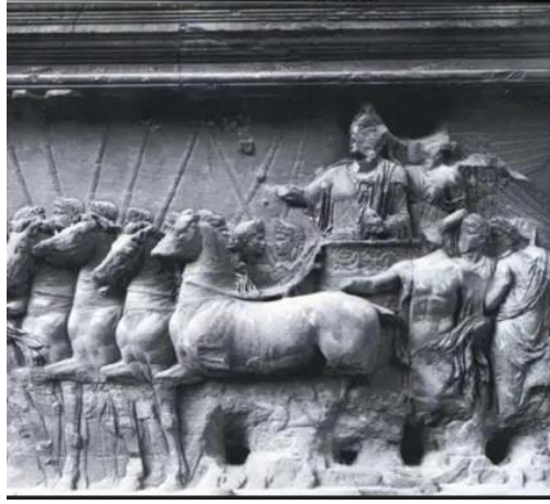
Res. 8: Genius Populi Romani, Genius Exercites ve Genius Senatus. Titus Zafer Takı (Özgan 2013b, 35, res. 21).