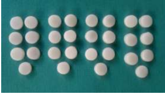
Resim 2. Ceramco 3 seramik örnekler