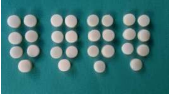
Resim 1. Noritake seramik örnekler

Hobson, Leicester, U.K.) ile yüzey pürüzlülükleri değerlendirildi. Elde edilen verilerin istatistiksel analizi üç yönlü varyans analizi testi kullanılarak yapıldı. Çoklu karşılaştırmalar Duncan testi ile yapıldı.