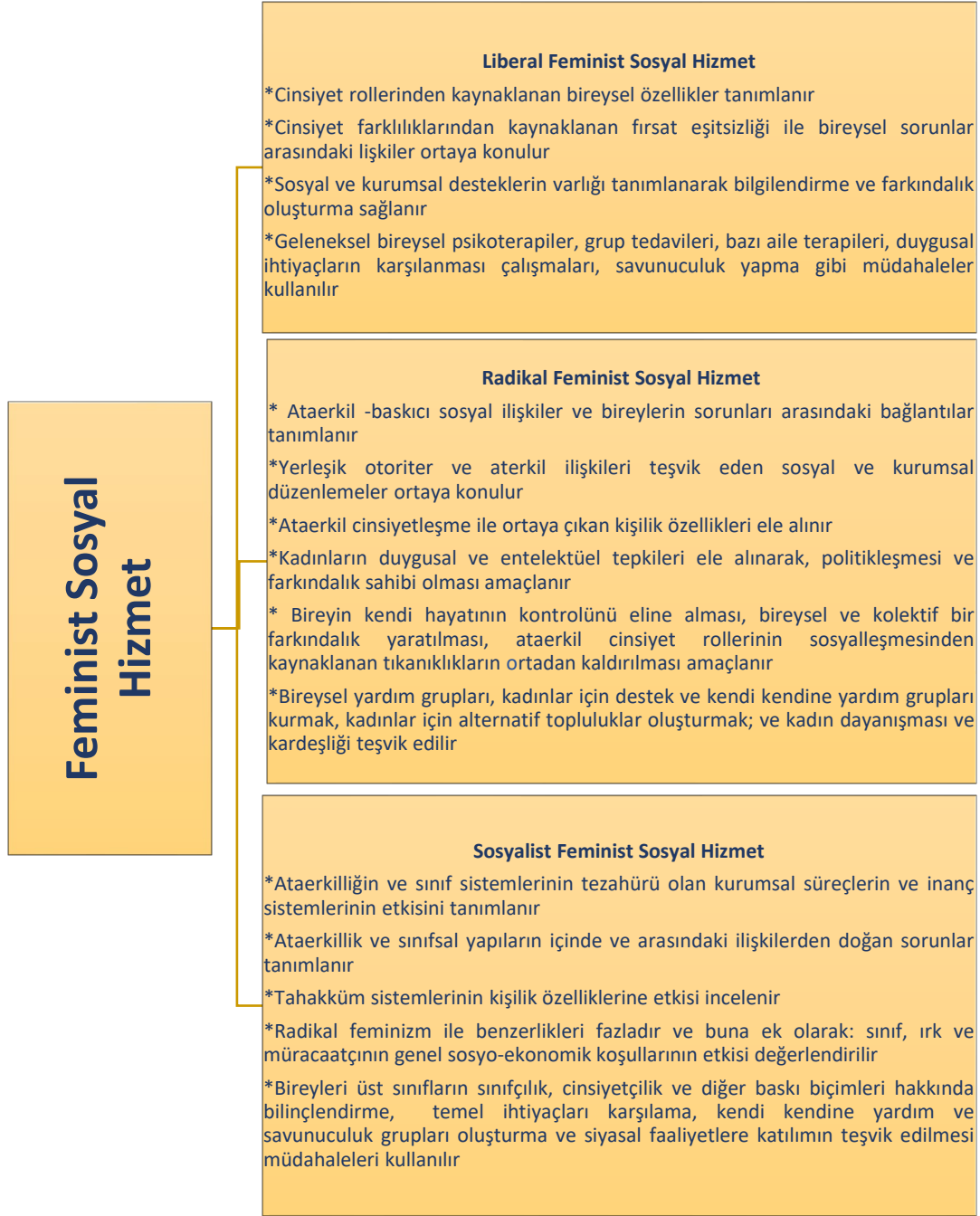
Şekil 2. Liberal, radikal ve sosyalist modellerde feminist sosyal hizmet (Nes ve İadicola, 1989) 1

Güç eşitsizliklerinin olduğu alanlarda çalışmak, doğası gereği güçlendirme yaklaşımını içinde bulundurur. Güçsüz olduğuna köklü bir şekilde sosyal, politik ve toplumsal olarak inandırılmış gruplar olan kadınlar, bu noktada kendi güçlerinin farkına varmaya en fazla ihtiyaç duyan bireylerdir. Kadınlarla çalışan sosyal hizmet uzmanları onları "zayıf cinsiyet" algısından uzaklaştırmaya çalışarak, karşılaştıkları psiko-sosyal problemleriyle güçlü bir şekilde baş edebilecek güce sahip olduklarına inandıracak ve onlara kadın olmayı bir avantaja dönüştürülebileceği mesajını verebilecek fırsata sahip bir konumdadırlar (Russel, 1989). Dominelli (2002, s.107) feminist yaklaşımın mesleğe diğer uygulamalar kadar sağlam yerleşmediğini ve bu nedenle de feminist uygulamada müdahalelerin ne tür sonuçlar doğuracağına da dikkat edilmesi gerektiğini vurgulamaktadır. Sosyal hizmet uygulaması