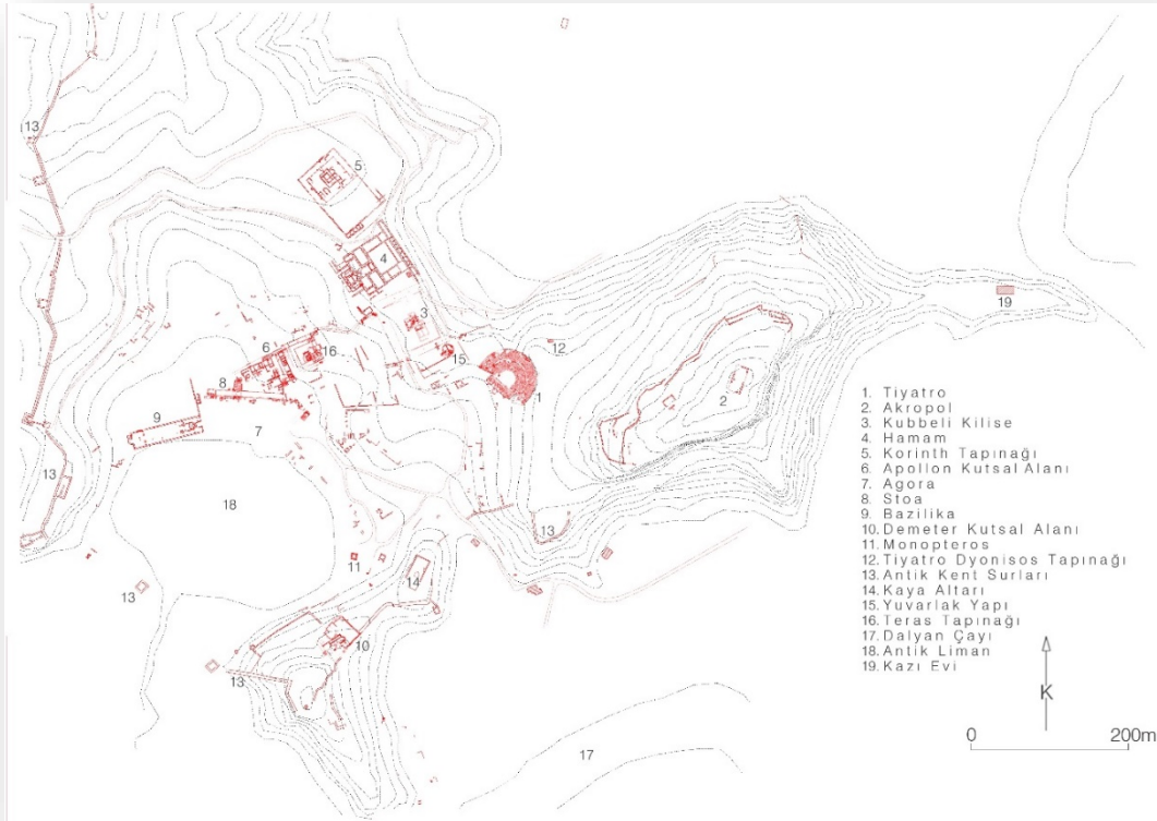
Res. 2. Kaunos, Vaziyet Planı