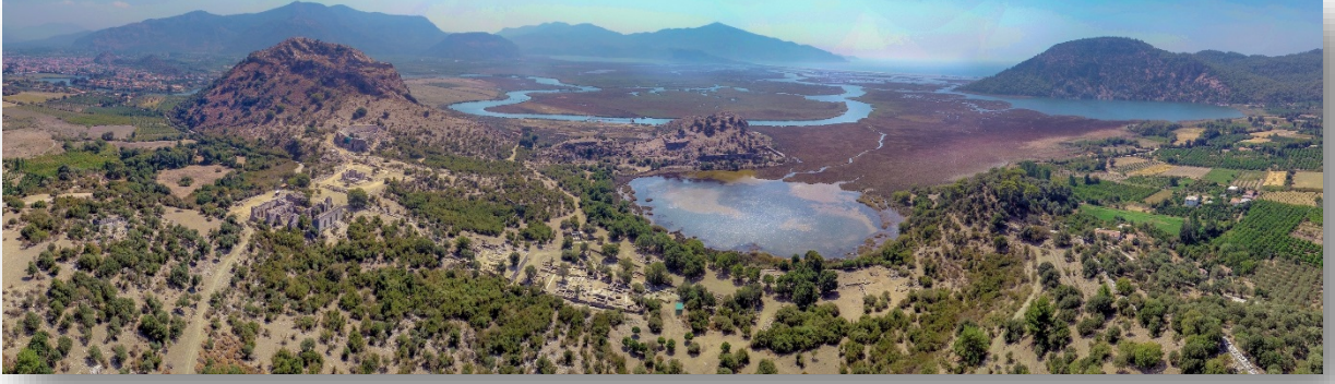
Res. 3. Kaunos, Topografya