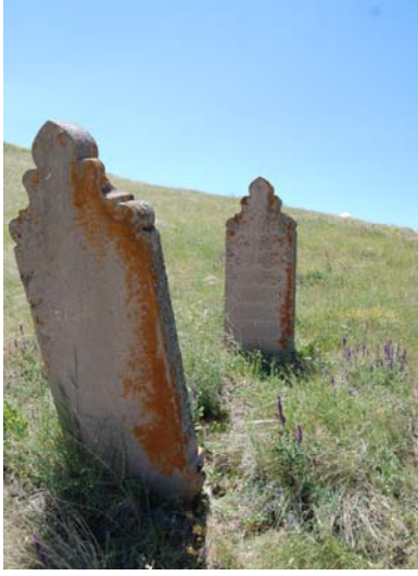
Resim 16. 4 No'lu mezar