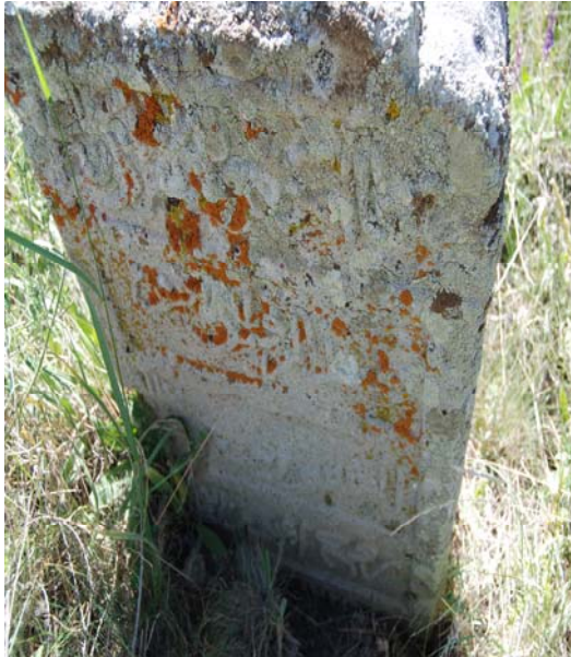
Resim 20. 5 No'lu mezarın kırık başucu şahidesi ve kitabesi