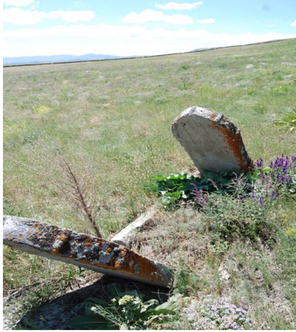
Resim 11. Toprakkale Köyü Mezarlığı'nda bulunan 1 No'lu mezar