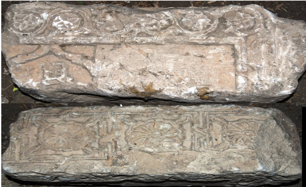
Resim 22. Hamur Kümbeti içinde bulunan bezemeli mezar taşı parçaları