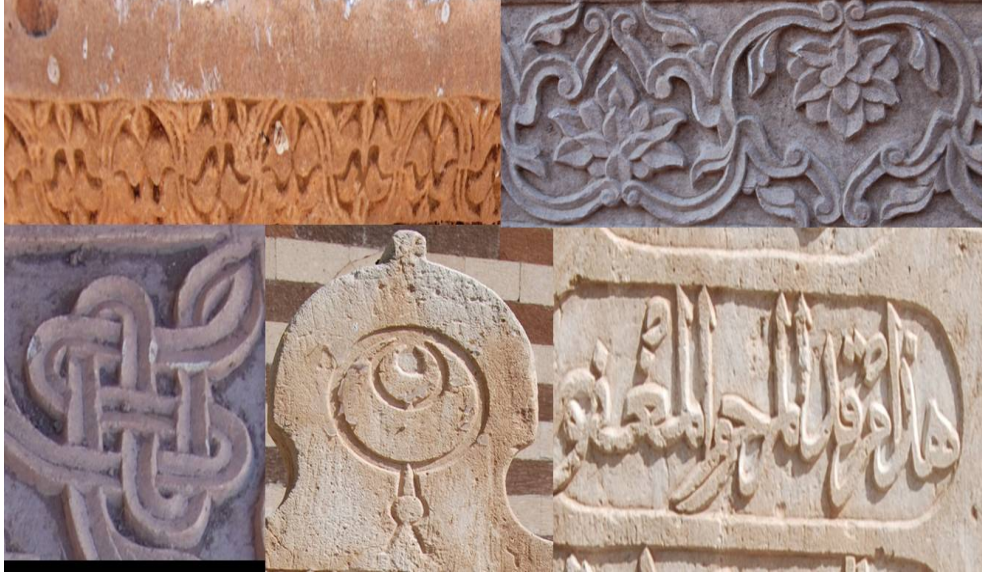
Resim 21. Eski Bayazıt'ta bulunan Osmanlı dönemi mezar taşlarında bezeme örnekleri