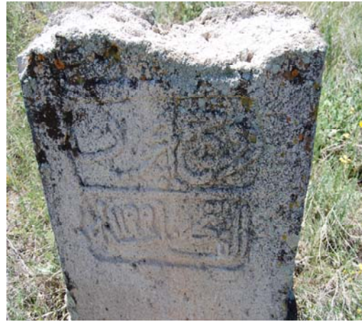
Resim 15. 3 No'lu mezarın başucu şahidesinin alt parçası