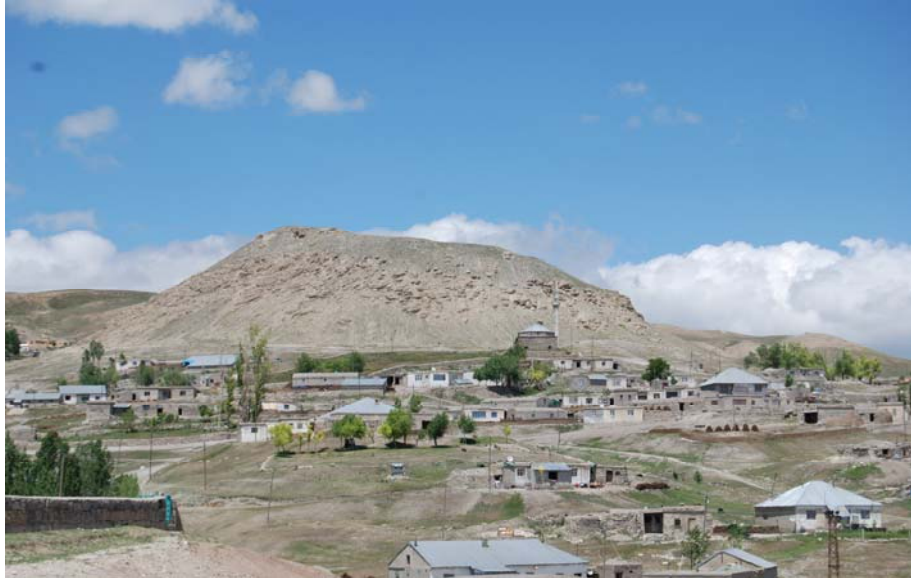
Resim 1. Toprakkale Köyü genel görünümü