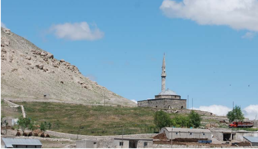
Resim 2. Toprakkale Köyü Camii haziresi