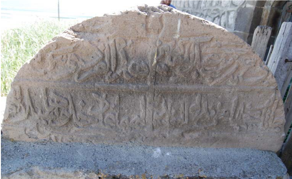
Resim 3. Hazirenin girişinde bulunan kitabe