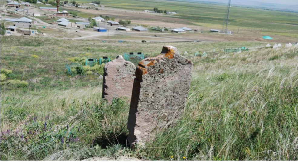
Resim 10. Toprakkale Köyü Mezarlığı genel görünümü