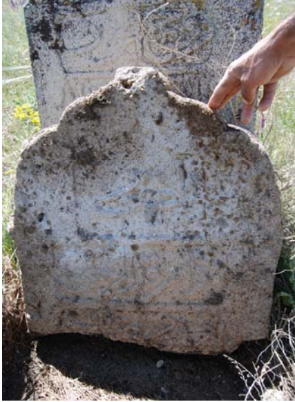
Resim 14. 3 No'lu mezarın başucu şahidesinin üst parçası