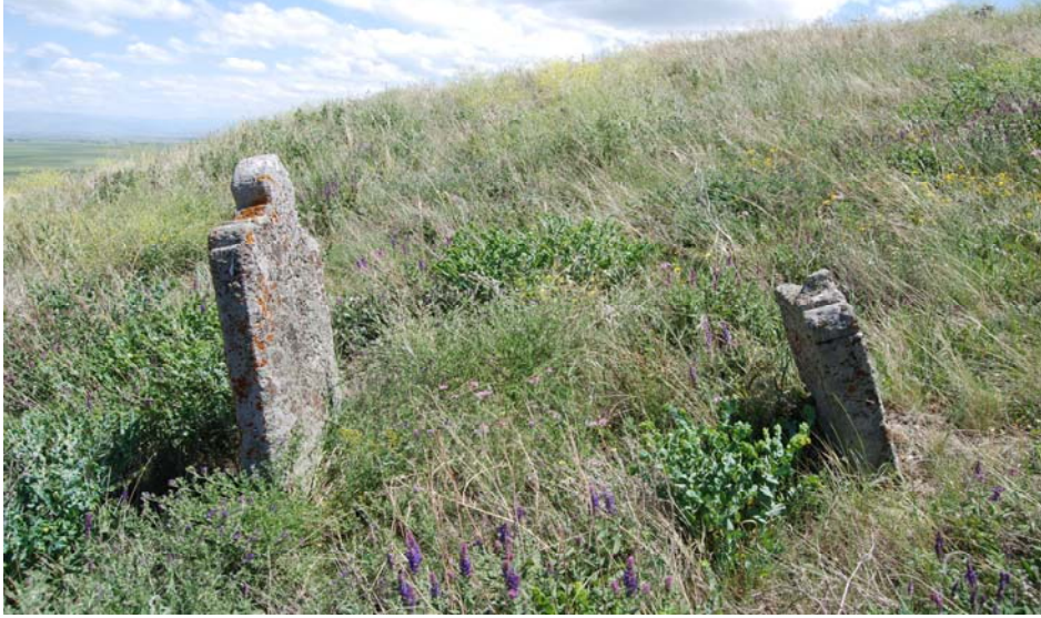
Resim 19. 5 No'lu mezar