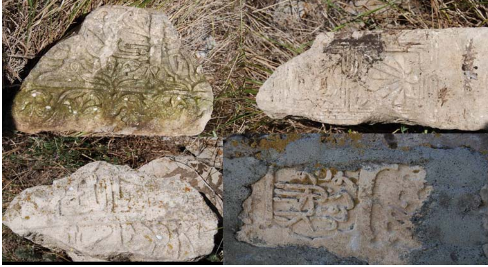
Resim 4. Hazirede bulunan kırık mezar taşı parçaları