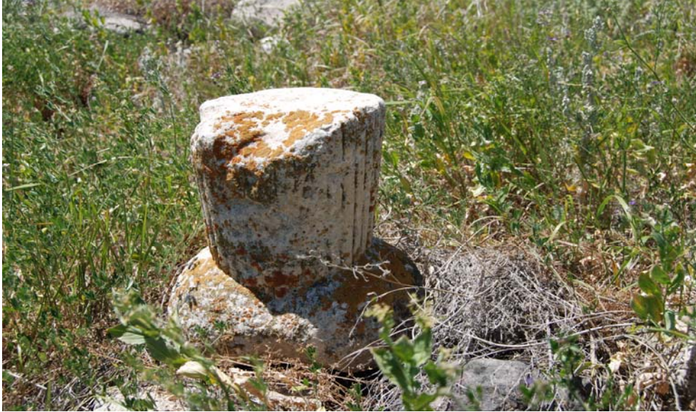
Resim 7. Kavuk formlu 2. tip başlık