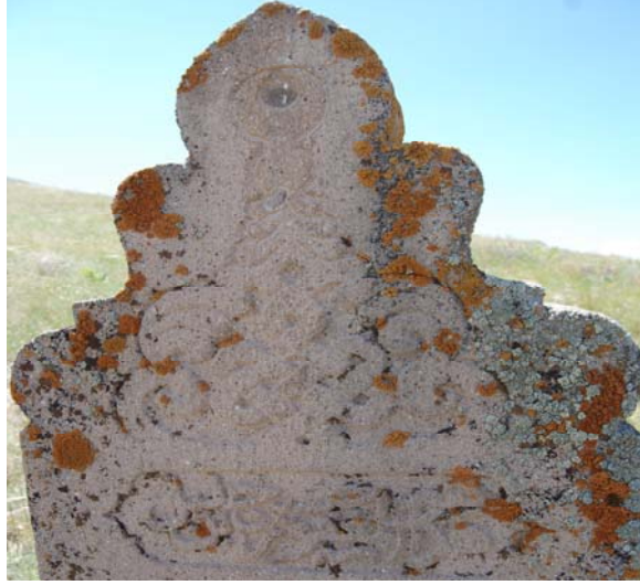
Resim 17. 4 No'lu mezarın başucu taşının tepeliğindeki bezeme