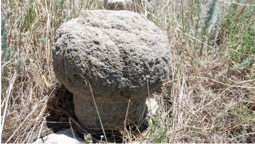
Resim 5. Hazirede bulunan sarık formlu başlık