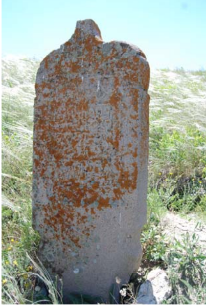
Resim 12. 2 No'lu mezarın ayak taşı