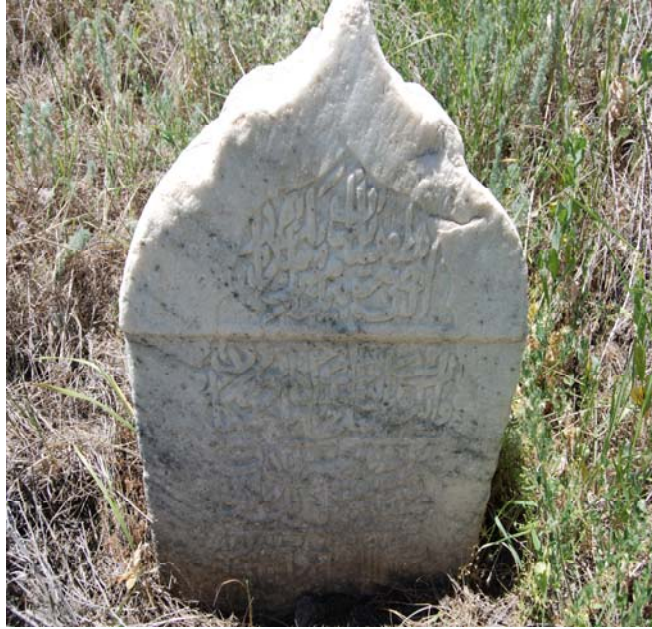
Resim 9. Hazirenin orta kısmında bulunan mermer mezar şâhidesi