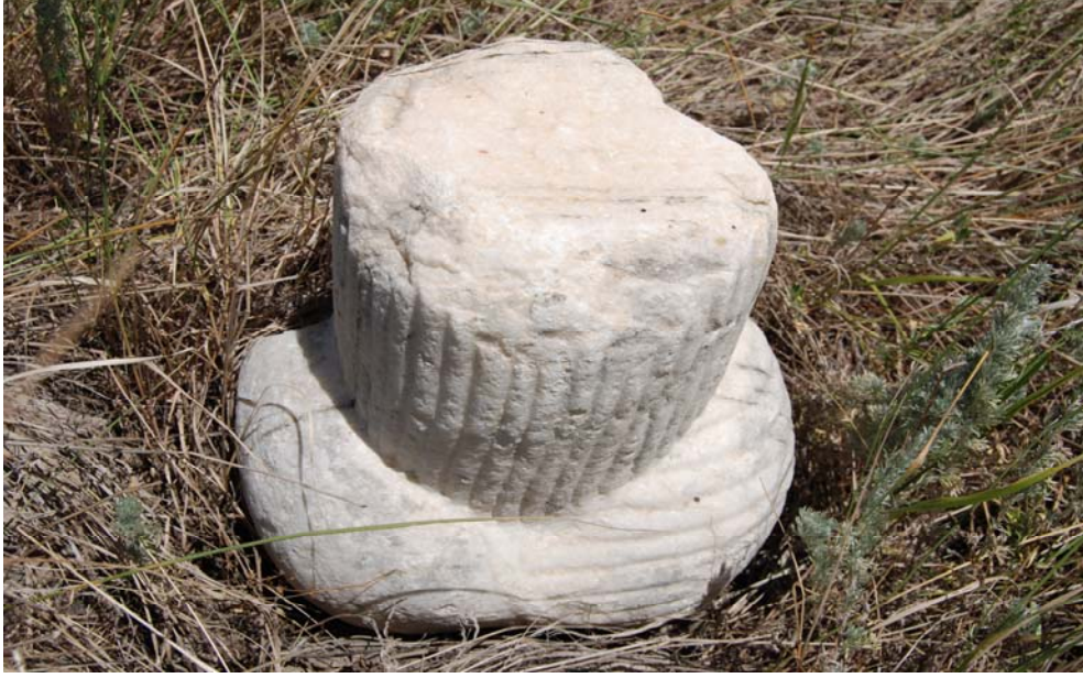
Resim 6. Kavuk formlu 1. tip başlık