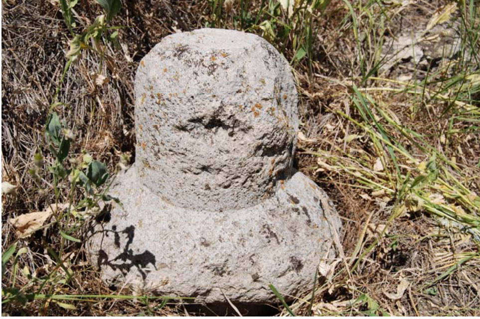
Resim 8. Kavuk formu 3. tip başlık