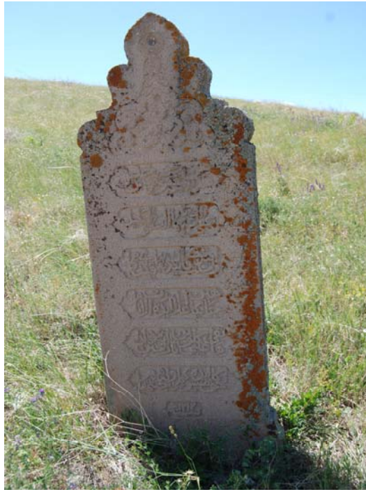
Resim 18. 4 No'lu mezarın başucu şâhidesi ve kitabesi