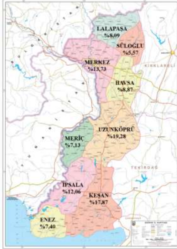
Resim 1: İl Yüzölçümü Bütününde Edirne İlçelerinin Yüzölçüm Oranları (km 2 )

Resim 1.'de görüldüğü gibi il yüzölçümünün %19,28'i Uzunköprü ilçesine aittir.