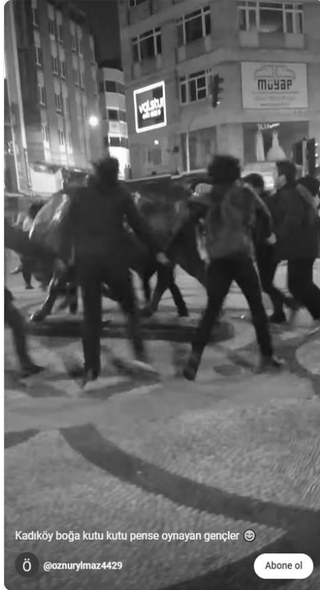
Şekil 9&10. Boğa Heykelinde Oyun (tariksw7474, URL-8 & Öznu Yılmaz, URL-9)

Bu oyuncu yaklaşımı mümkün kılan ise, aslında Altıyol Meydanı ve Boğa Heykelinin topluma Kevin Lynch'in (1996) "The Openness of open space" isimli makalesinde tanımladığı biçimde bir "açık mekân" sunuyor olmasıdır. Lynch bu makalesinde, bir alanın fiziksel parametre ve erişilebilirliğinin açıklığının anahtarı olmasına rağmen, belirli bir alanın kullanım ve anlamın yorumlanmasına açık olma derecesinin de kritik olduğunu savunmaktadır. Ona göre bir alan, insanların özgürce hareket etmesine izin