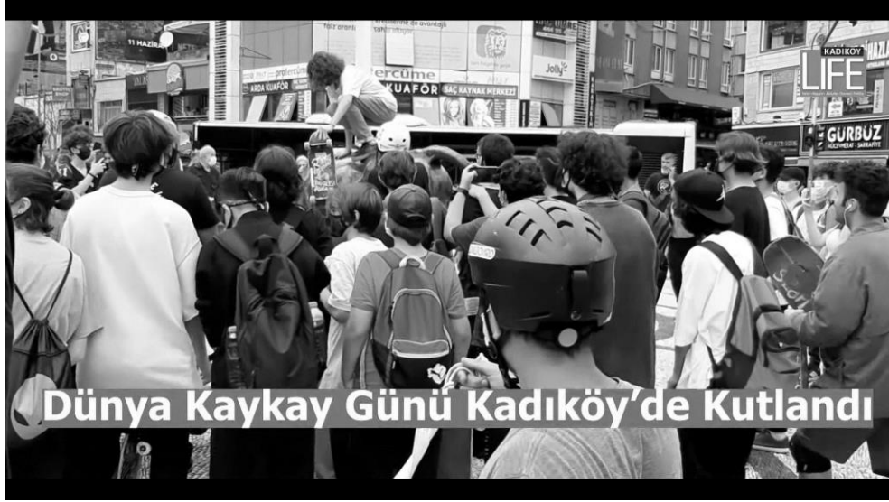
Şekil 8. Boğa Heykelinde Kaykay Günü Kutlaması (KadıköyLife, URL-7).