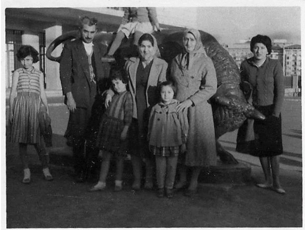
Şekil 3. Boğa Heykeli Lütfi Kırdar Spor ve Sergi Sarayı'nın Önünde (Anonim, URL-3)