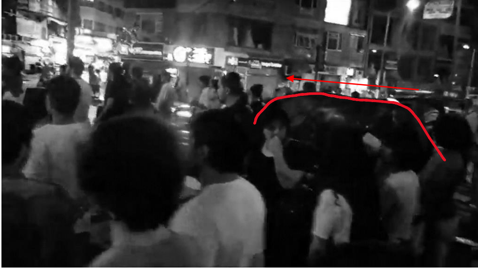
Şekil 6. Altıyol'da Duran Adam Eylemi, Boğa Heykeli ve yönü kırmızı ile işaretlenmiştir. (Can Çınar, URL- 6).

Bu perküsyon setini, bu çalışma kapsamında tespit edilen prosedürel yaklaşımların ikinci kümesi olan “oyun” kapsamında da ele almak mümkün. Burada “oyun”dan kasıt Huizinga'nın (1970) “Homo Ludens” isimli kitabında ele aldığı, toplumsal ve kültürel kodları olan, anlık ve kendiliğinden gelişen, kuralsız ve öngörülemez olan, yalnız çocukların değil tüm yaş gruplarının gerçekleştirdiği “oyun”dur. Dolayısıyla bu araştırma kapsamında meydana geldiği tespit edilen taraftar kutlamaları, müzik ve mizah gösterileri, dini kutlamalar bu kavram kapsamında ele alınabilir. Nitekim bu türden oyunlar, “kamusal mekânın değiştirici, dönüştürücü olma hali ile örtüşmekte”dir (Dündar, 2022, s.114). Herkese açık bu oyun anlayışının bir araya getirci özelliği bulunmakta, bununla birlikte Boğa Heykeline herhangi bir kutsallık atfedilmeyişi de gerekli özgürlük alanını ve esnekliği sağlamaktadır. Burada oyunun, “yorumlayıcı” bir anlayışı söz konusudur (Jones, 2013, s.1150). Bu yaklaşım, kamusal mekân kullanıcılarının belirli nesnelere öngörülenden farklı şekillerde yorumlamalarının çeşitli yollarına odaklanmaktadır ve bir bakıma bireylerin kamusal mekânda gerçekleştirdiği “anlam oyunları” üzerinde durur. İnsanlar bir oyuncak olarak tasarlanmamış olan Boğa Heykelinin üzerine çıkmakta, üzerinden kaykayı ile atlamakta (Şekil 8), onu bir ağırlık sehпасı gibi kullanmakta (Şekil 9), etrafında kutu kutu pense oynamaktadır (Şekil 10).