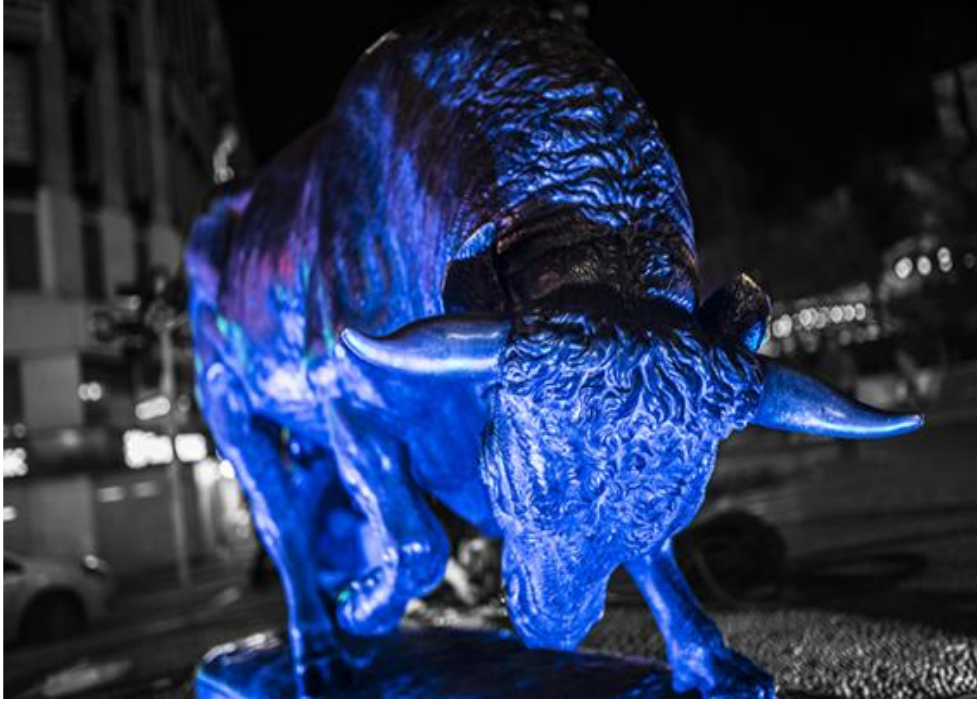
Şekil 5. Otizm için maviye bürünmüş Boğa Heykeli (Gazete Kadıköy, URL-5).

Bu eylemler her ne kadar özlerinde politik olmaları sebebiyle benzerlik taşısalar da, eylem biçimleri ve Altiyol Meydanı / Boğa Heykeli ile kurdukları ilişki açısından oldukça farklıdır. Eylemlerin bir kısmı Kadıköy rıhtımında başlamakta, Boğa Heykeli'ni bir duraklama noktası olarak kullanıp, Bahariye'ye doğru devam etmektedir. Bir başka kısmı ise Boğa Heykelini başlangıç noktası olarak kullanmakta, bir basın açıklamasının ardından harekete geçmektedir. Bir üçüncü grup ise, Otizm farkındalık eylemi gibi (Şekil-5), Boğa Heykeline direkt olarak temasta bulunmaktadır.