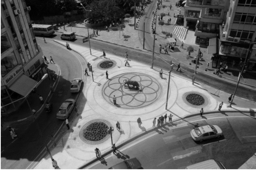
Şekil 2. Altıyol Meydanı (Kadıköy Belediyesi, URL-2)

Boğa Heykeli'nin özellikle odak olarak önemli katkısı olmakla birlikte, bu yıllarda ülke genelinde salt ideolojik kamusal alanın terk edilmesi de önem taşımaktadır. Liberalizm ile birlikte kamusal alanda sivil inisiyatifler görünür olmaya başlamış, devletin bu alandaki yeri ise sorgulanmaya başlamıştır. Böylelikle sivil kamunun temelleri oluşturulmaya başlanmış, kamusal alanda özgürlük, insan hakları ve adalet gibi kavramlar tartışılmaya başlanmıştır (Yıldırım, 2015, s.45). Altıyol böyle bir ortamda kamusal mekân olma niteliği kazanmış, taşındıktan sonra zamanla Kadıköylüler için önemli bir temsil aracı haline gelen Boğa Heykeli ise bu yönde katkıda bulunmaya bugün de devam etmektedir.