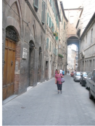
Foto. 2 Siena