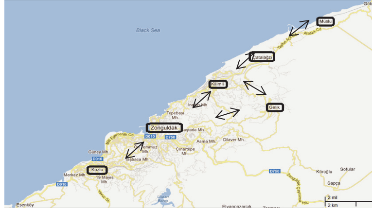
Şekil : 1 Zonguldak Orta Ölçekli Kentsel Alanı