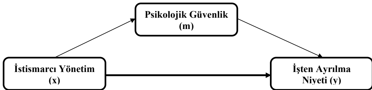
Şekil 1. Araştırmanın Kavramsal Modeli

Kavramsal model Şekil 1'de sunulmaktadır. Araştırmanın kavramsal modeli istismarcı yönetim (x), psikolojik güvenlik (m) ve işten ayrılma niyeti (y) değişkenlerinden oluşmaktadır.