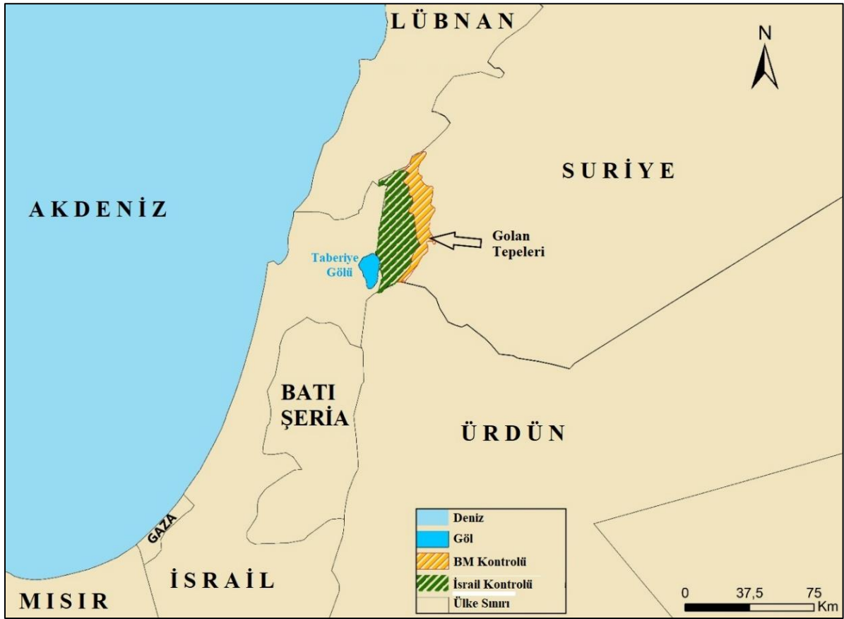
Şekil 1. Golan Tepelerinin Lokasyon Haritası.

Golan Tepeleri, Suriye, Lübnan, Ürdün, Filistin ve İsrail'in sınırlarının kesiştiği alanda yer almaktadır. Ortadoğu'nun en önemli kentlerinden, Suiye'nin de başkenti olan Şam'a yalnızca 35 km, İsrail'in en önemli kentlerinden ve limanlarından biri olan Hayfa'ya ise yüz kilometreden daha az mesafededir. 1200 km 2 si İsrail'in, 270 km 2 si BM'in ve 390 km 2 si ise Suriye'nin kontrolünde olmak üzere toplamda 1860 km 2 lik alan kaplamaktadır (Şekil 1).