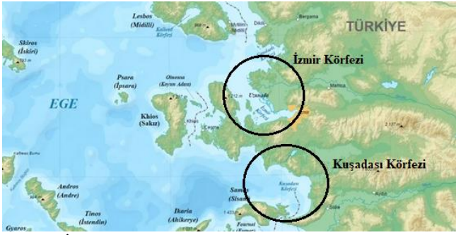
Şekil 1. İzmir ve Kuşadası Körfez'lerinin genel görünümü Figure 1. General view of İzmir and Kuşadası Bays

gonadların mikroskopik olarak incelenmesiyle belirlenmiş ancak indeks değerleri eşeylere göre belirlenmemiştir.