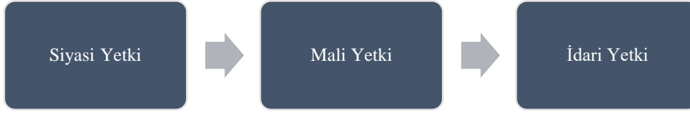
Şekil 4: Yerel-Merkez İlişkisinde Olması Gereken Yetkiler

Şekil 4’te yerel-merkez ilişkisinde olması gereken üç temel yetkiye yer verilmiştir. Bu etkiler sırası ile siyasi, mali ve idari yetkidir. Yerel yönetimlere bu yetkilerin verilmesi sonucunda yerel-merkez ilişkileri demokratik ülkelerde olduğu gibi ademi merkeziyetçilik, yerellik, şeffaflık, yetki devri ve yönetim ilkeleri hâkim olacaktır. Yerele siyasi yetki vermek yerel özerklik adına merkezle olan ilişkiye katkı sağlamaktadır. Mali yetki vermek yerel yönetimlerin kendi gelirlerini artırması ve daha fazla hizmet vermesi anlamına gelmektedir. İdari yetki vermek Mısırlıların daha demokratik ortamda yönetilmesi ve daha iyi hizmet almaları açısından önem taşımaktadır. Bu sebep ile merkez-yerel ilişkisinde siyasi, mali ve idari yetkilerin yerel yönetimlere verilmesi Mısır’ın demokratik olarak yönetilmesi açısından hayati öneme sahiptir.