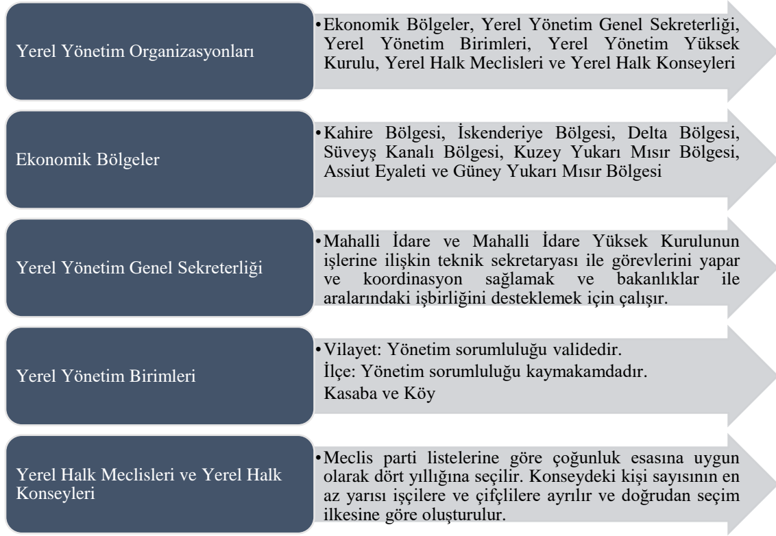
Şekil 3: Mısır Arap Cumhuriyeti'nin Yerel Yönetimlerin Yapısı