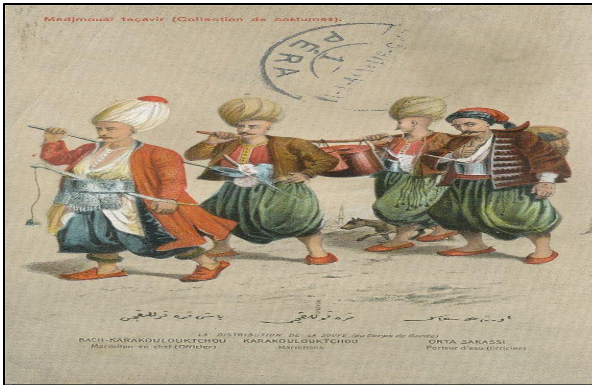
Resim-II: Baş Karakullukçu, Karakullukçu ve Orta Sakası