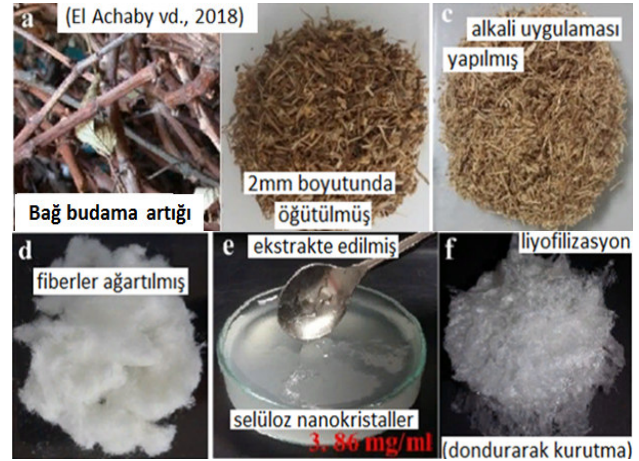
Bağ budama artığı / The vineyard pruning residue, 2 mm boyutunda öğütülmüş / Milled to 2 mm size, Alkali uygulaması yapılmış / Alkaline application was done, Fiberler ağartılmış / The fibers bleached, Liyofilizasyon (dondurarak kurutma) / Lyophilization (freeze drying)

Asma dalının, kabuk fiberlerinin (özellikle dış kabuktaki) uygun mukavemet özellikler göstermesinden dolayı kompozit malzeme uygulamalarında kullanılabilme potansiyeli bulunmaktadır [14]. Yine David vd. [36, 37], asma sürgünü ve şaraphane posasının kompozit malzemelerde dolgu maddesi olarak kullanılabileceğini açıklamışlardır. El Achaby vd. [41] ise, asma yıllık sürgünlerinden elde ettikleri selüloz nanokristallerinin, nanokompozit malzemelerin geliştirilmesinde kullanımları üzerine çalışma yürütmüşlerdir ve materyallerin gerilme direncinin güçlendirilmesi gibi başarılı sonuçlar elde etmişlerdir (Şekil 5).