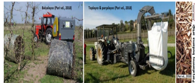
Balyalayıcı / The baler, Toplayıcı – parçalayıcı / The collector - shredder, Parçalanmış budama artığı / The shredded pruning residue