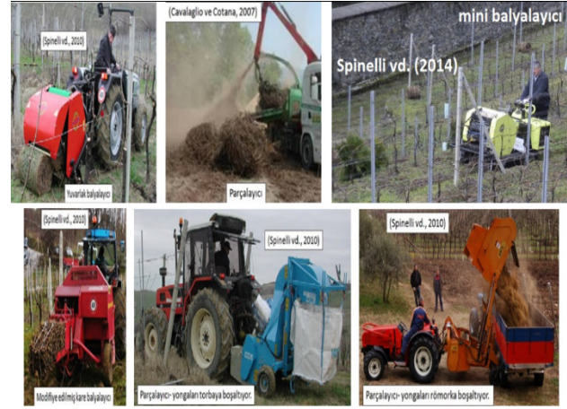
*Yuvarlak balyalayıcı / The round baler, Parçalayıcı / The shredder, Mini balyalayıcı / The mini baler, Modifiye edilmiş kare balyalayıcı / The modified square baler, Parçalayıcı yongaları torbaya boşaltılıyor / The shredder is discharging chips into the bag, Parçalayıcı yongaları römorka boşaltılıyor / The shredder is discharging chips into the trailer

Pari vd. [90], bağ (Y sistem, uzun budama), elma bahçesi ve şeftali bahçesi budama artıklarını toplayan ve balyalayan traktör arkasına monte edilmiş bir makine üzerine çalışmışlardır (Şekil 3). Çalışmadaki bir makine budama artıklarını balya haline getirirken (elma budama artığı toplamada kullanılmıştır), diğer makine ise budama artıklarını toplayıp yongalara parçalayarak arkasındaki torbaya doldurmaktadır (bağ ve şeftali budama artığı toplamada kullanılmıştır). Toplanan biyokütle bağ için 1.44 ton/ha (2016), şeftali bahçesi için 0.76 ton/ha (2016) ve elma bahçesi için 2.26-8.3 ton/ha (2014-2016) budama artığı olmuştur.