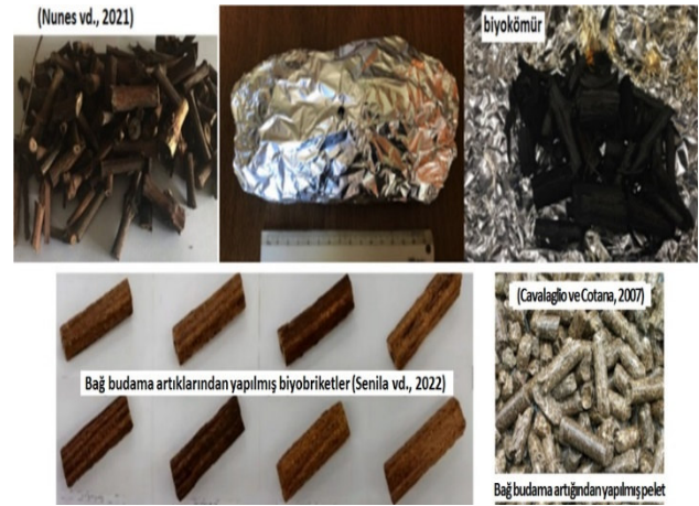
Biyokömür / The biochar , Bağ budama artıklarından yapılmış biyobriketler / The biobriquettes made from vineyard pruning residue , Bağ budama artıklarından yapılmış pelet / The pellets made from vineyard pruning residue

Bağ budama artıklarının bir parçalayıcıdan geçirilip yonga elde edilmesinden sonra peletleme işlemi yapılmaktadır. González-Barragán vd. [57], asma sürgünleri yongalarından elde ettikleri peletlerin pürüzsüz yüzeyli, dayanıklı, düşük kül ve klor yüzdeleri olduğunu ifade etmişlerdir. Asma budama artığı yongalarından elde edilen peletler, enerji üretiminde kullanılmaktadır [34, 32].