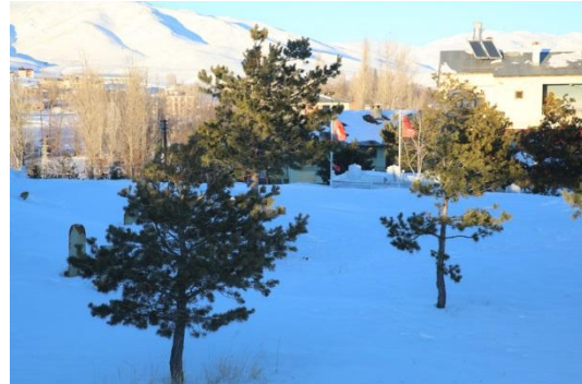
Fotoğraf – 12 (Aydın-tepe Kalesi'nin üzerinden ulaşılabilen mezarlık alanı-Kayalık Tepe)