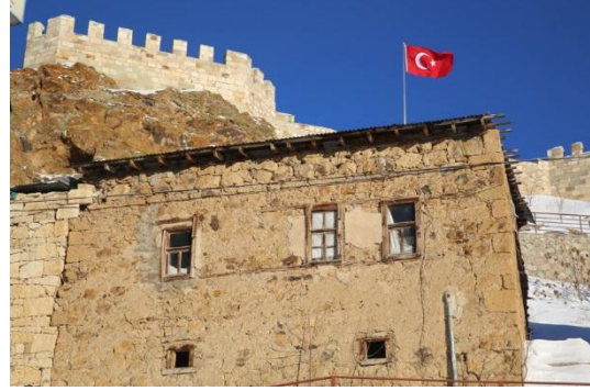
Fotoğraf – 14 (Modern evlerin dışında kalan Aydın-tepe evlerinden bir görüntü)