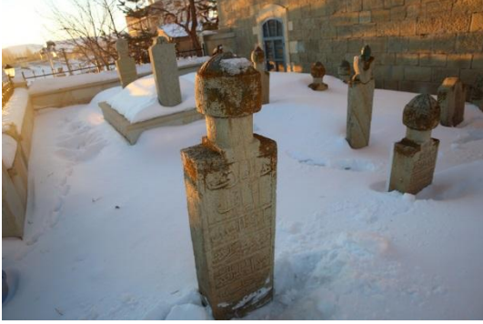
Fotoğraf – 19 (Merkez Camii Haziresi – mezar taşı: Hüve'l-hallaku'l-baki ulema-i izamdan ve müderrisin-i kiramdan Abdülcelil Efendi ruhuna Fatiha)