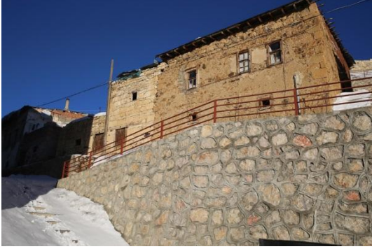
Fotoğraf – 13 (Modern evlerin dışında kalan Aydın-tepe evlerinden bir görüntü)