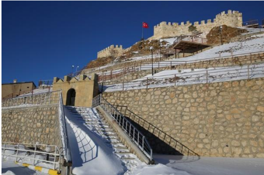
Fotoğraf – 11 (Aydın-tepe Kalesi'nin altında konumlanan yeraltı şehri çıkış kapısı) 6