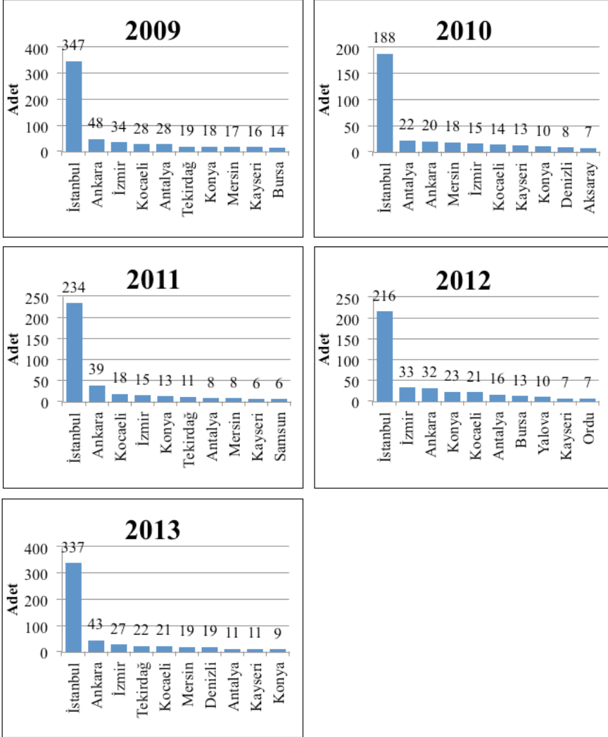
Şekil 3: iflasın ertelenmesi dava sayılarının (2009-2013), ilk 10 il'e dağılımı.

Türkiye'de ilk 10 ilin iflasın ertelenmesi konulu dava oranı (iflasın ertelenmesi konulu dava sayısı toplamının Türkiye toplamına oranı) 2009-2013 yılları arasında görece istikrarlı bir seyir izlemiş olup yıllık ortalama % 77,95 seviyesinde gerçekleşmiştir. Bu oran 2009 ve takip eden yıllarda sırasıyla, % 77,52, % 77,21, % 82,68, % 78,26 ve % 79,36 olmuştur.