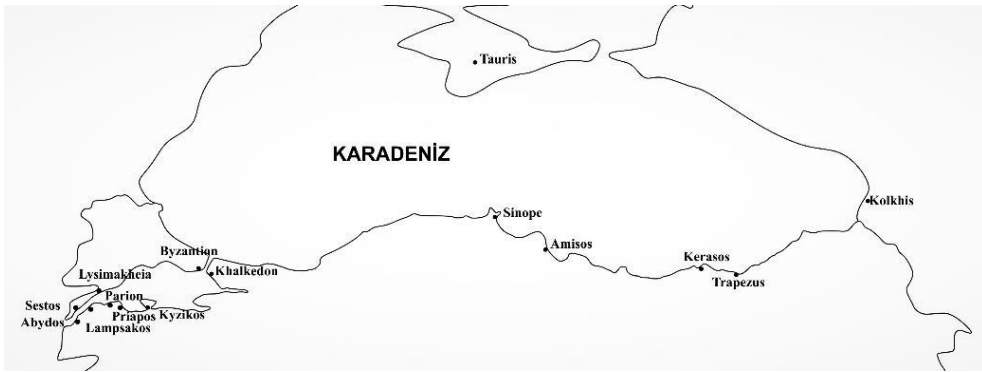
Çizim 2: Marmara ve Karadeniz'de Bulunan Koloni Kentleri