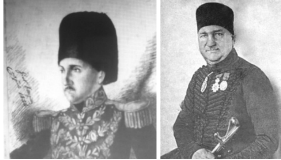
Resim 14, Giuseppe Donizetti’nin Fransada iken karakalemle yapılmış “Napolyon ceketli” bir resmi.