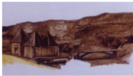
Resim 5 : Sultan Melik Türbesi ve Psephellusaucherianus çiçeğinin tasarım aşaması