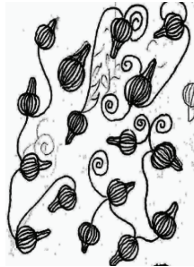
Resim 2: Sonchus Erzincanicus çiçeğinin desene dönüşümü