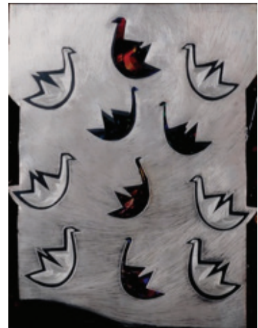
Resim 8 : Kuş figürlerinin bakır üzerine