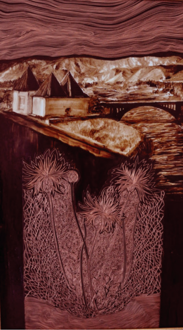
Resim 7 : Sultan Melik Türbesi ve Psephellusaucherianus çiçeği ile kopozede edilmiş çalışma