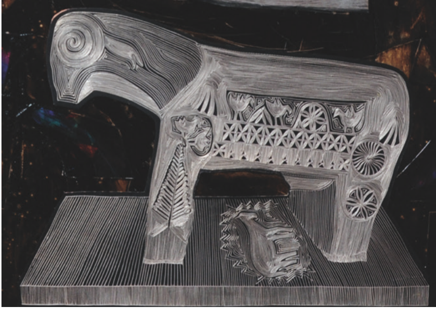
Resim 9 : Koç Figürlü Mezar Taşı Figürünün El Teklisi ile Bakıra İşlenmesi