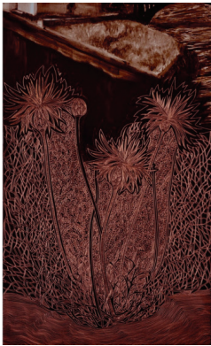
Resim 4 : Psephellusaucherianus bitkisinin desene dönüşümü

çalışmada her ne kadar renk var gibi değerlendirilse de kullanılan bu renk sadece arka plan rengi olarak kalmıştır. Resmin içinde bir eleman olarak yer almamaktadır. İkinci çalışmada ise, renk hiç kullanılmamıştır.