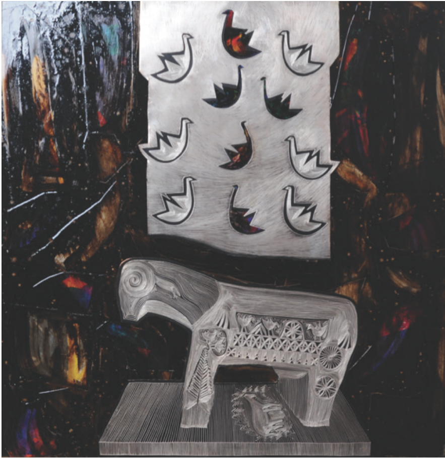
Resim 10 : Koç Figürlü Mezar Taşı Figürünün bakıra işlenmesi ile oluşturulan çalışma