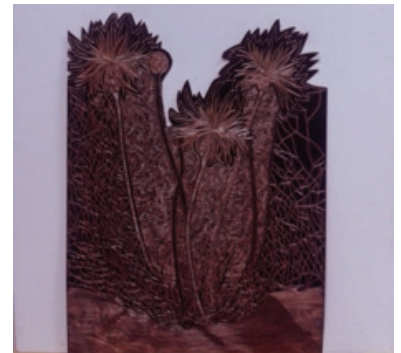
Resim 6 : 6. Psephellusaucherianus bitkisinin bakıra işlenmiş biçimi