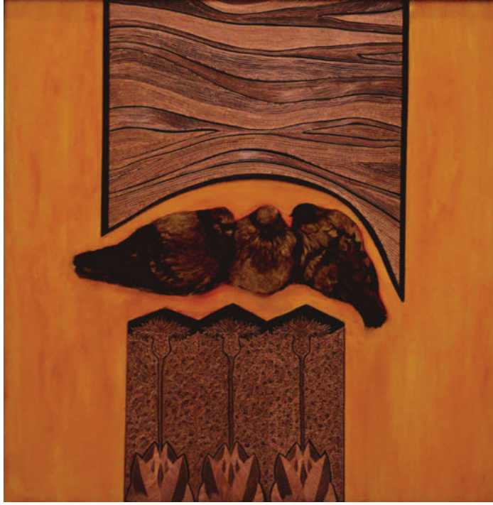
Resim 3: Erzincan endemik bitki türü deseni ile kompoze edilmiş çalışma

İkinci çalışmada Erzincan ilinin Kemah ilçesinde yetişen Psephellusaucherianus isimli bitkinin desene dönüştürülüp bakıra işlenmesi çalışması yapılmıştır. Arka plana ise Kemah ilçesinin tarihi değeri olan Selçuklu mimarisinin bir örneği Sultan Melik Türbesi yüzey üzerine zift ile uygulanmıştır. Uygulanan resmin üzerine el teklisi tekniği ile işlenen bitki yapıştırıcı ile yapıştırılmıştır.. Bitki desenleri resmin dekoratif tamamlayıcısı gibi durmasını engellemek için bu resimde Erzincan ilinin Kemah ilçesinde görülen bitkinin bakıra işlenmesinden sonra, arka planına bir coğrafik bağ kuran türbe çalışılmıştır. Selçuklu mimarisinin örneklerinden biri olan bu yapının arka plana çalışılması ile figür desen ilişkisinin zayıflığı giderilmeye çalışılmıştır. Bunda nispeten başarılı olunmuş, fakat bu şekli ile de çalışmanın daha çok geleneksel ve yöresel bir nitelik kazan-