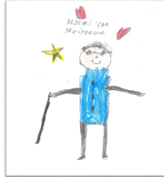
-Dedemi çok seviyorum, onu çizdim.

Çocukların çizimlerinde yer verdikleri sevdikleri kişilerle yaptıkları aktivitelere ilişkin bilgiler Tablo 2'de sunulmaktadır.