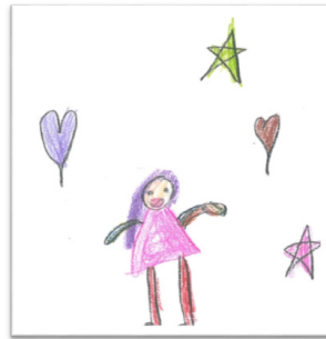
-Halamın resmini yaptım.